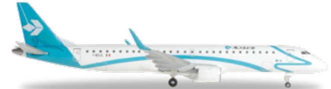
↔ 7,7 cm 23,90 €