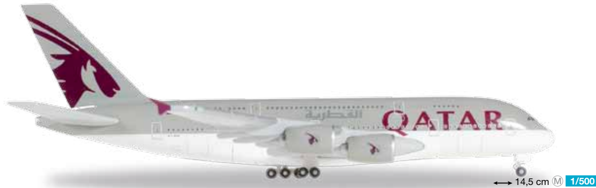
528702 Qatar Airways Airbus A380 – A7-APB 14,5 cm M 1/500 34,90 €

Die vielfach ausgezeichnete Airline betreibt derzeit eine Flotte von fünf A380, fünf weitere sollen in Kürze folgen. / The winner of numerous awards, Qatar Airways currently operates a fleet of five A380s. Five more are to follow shortly.