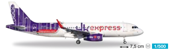
528481 Hong Kong Express Airbus A320 – B-LCC "Char Siu Baau" 7,5 cm M 1/500 23,90 €

Die vielfach ausgezeichnete Airline betreibt derzeit eine Flotte von fünf A380, fünf weitere sollen in Kürze folgen. / The winner of numerous awards, Qatar Airways currently operates a fleet of five A380s. Five more are to follow shortly.