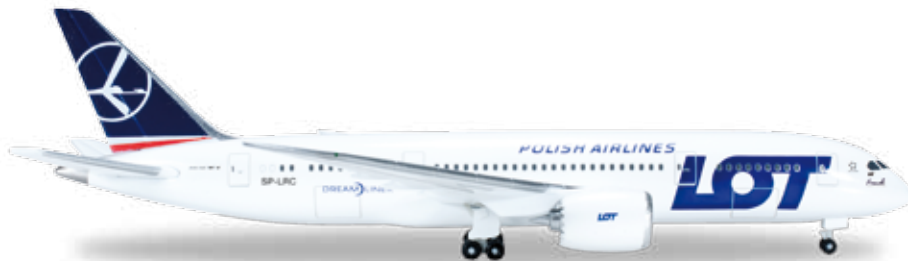
↔ 11,3 cm 29,00 €