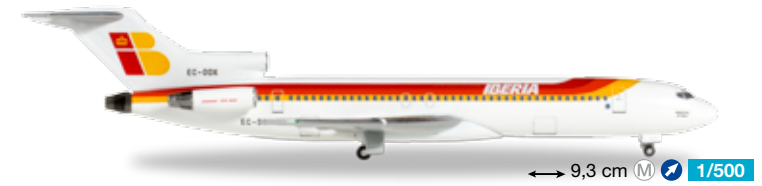
528467 Iberia Boeing 727-200 – EC-DDX "Monasterio de Poblet" 9,3 cm M 1/500 25,90 €

1935 absolvierte Qantas Australiens ersten internationalen Flug mit ganzen zwei Passagieren von Brisbane nach Singapur. Zum 80. Jubiläum dieser Premiere erhielt diese A330 eine Sonderaufschrift auf beiden Rumpfsseiten. / In 1935, Qantas operated Australia's first international flight with a total of two passengers from Brisbane to Singapore. Commemorating the 80 th anniversary of the international debut, this A330 was decorated with special titles on both fuselage sides.