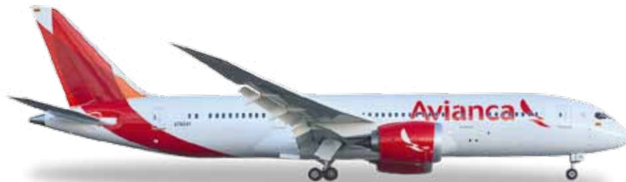
↔ 11,3 cm 28,90 €