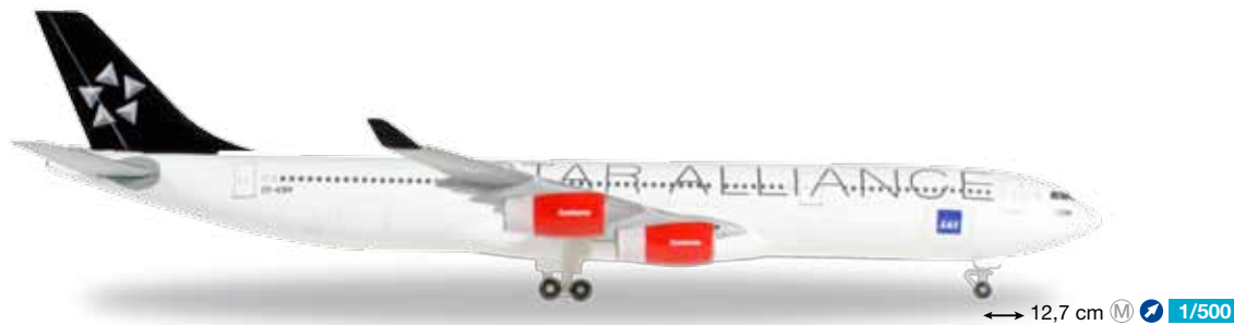
528474 SAS Scandinavian Airlines Airbus A340-300 "Star Alliance" – OY-KBM 12,7 cm M 1/500 28,90 €

Nach 28 Jahren stellte Iberia 2001 mit der "Monasterio de Poblet" ihre letzte 727 außer Dienst. / After 28 years, Iberia retired its last 727 in 2001, the "Monasterio de Poblet" having the honor of the final flight.