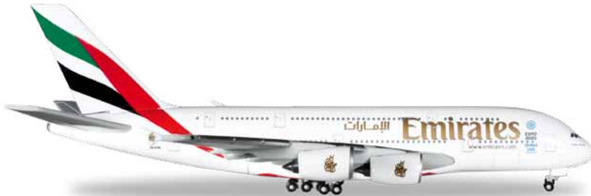
↔ 14,5 cm 34,90 €