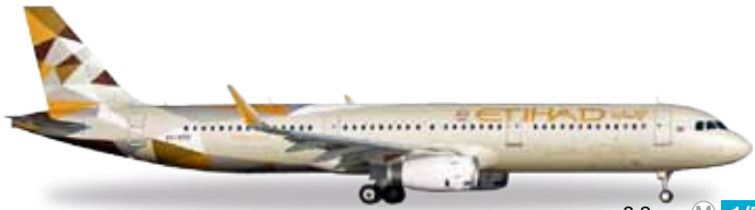
↔ 8,9 cm M 1/500