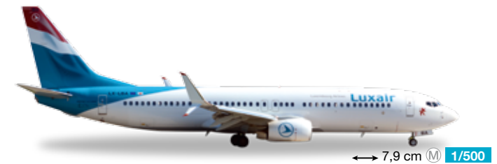
528436 Luxair Boeing 737-800 – LX-LBA 7,9 cm M 1/500 23,90 €

Der jüngste Flottenzugang erhielt die neueste Generation der Sprit sparenden Split-Scimitar genannten Winglets. / The currently youngest member of the fleet is equipped with the latest generation of fuel-saving split scimitar winglets.