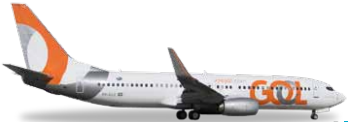
↔ 7,9 cm M 1/500

Die fliegende Sternwarte SOFIA (Stratosphären-Observatorium für Infrarot-Astronomie) ist ein Gemeinschaftsprojekt des Deutschen Zentrums für Luft- und Raumfahrt (DLR) und der US-Weltraumbehörde NASA. Hinter einer Luke im Rumpf verbirgt sich ein Teleskop, mit dessen Hilfe die Entstehung von Planetensystemen und Galaxien erforscht werden soll. / The flying observatory SOFIA (Stratospheric Observatory for Infrared Astronomy) is a joint project of NASA and the German aeronautics and Space research center DLR. The fuselage has been equipped with a telescope with which the formation of planetary systems and galaxies are to be researched.