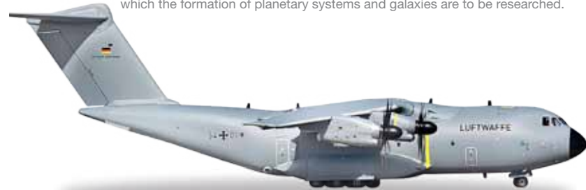
↔ 9,0 cm M 1/500