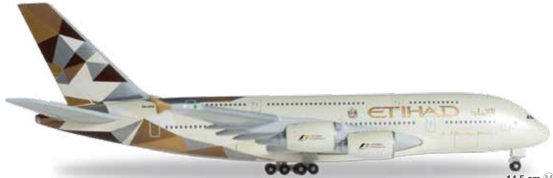
↔ 14,5 cm M 1/500