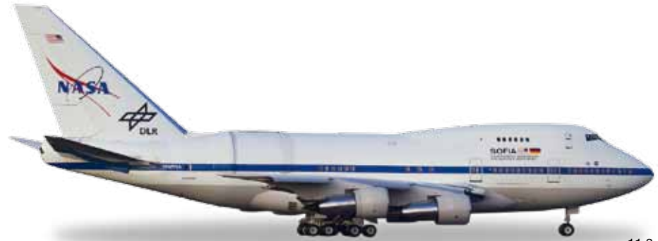
↔ 11,3 cm M 1/500