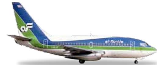
↔ 5,7 cm 22,90 €