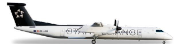
↔ 6,6 cm 22,90 €