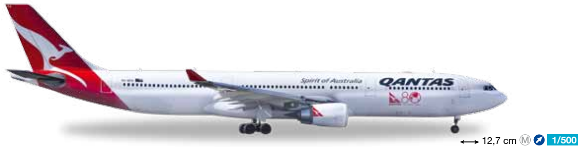
528672 Qantas Airbus A330-300 "80 Years of International Travel" – VH-QPA "Kununurra" 12,7 cm M 1/500 29,90 €

Die Skyline Hongkongs zielt Rumpf und Leitwerk der zwölf A320 der Billig-Airline. Einige Maschinen sind nach den in der Metropole beliebten Dim-Sum-Köstlichkeiten aus der kantonesischen Küche benannt. / Hong Kong's skyline adorns the fuselage and stabilizer of the twelve A320s of the low-cost airline. Some of the aircraft are named after Dim Sum dishes, a famous delicacy of the city.