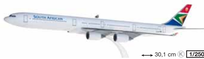
610476 South African Airways Airbus A340-600 – ZS-SNH ↔ 30,1 cm K 1/250 18,50 €