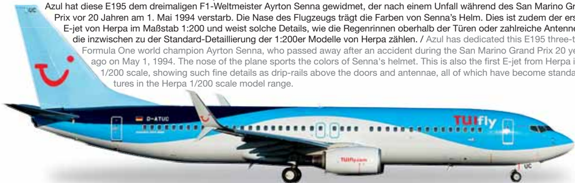
← 19,8 cm (K) 1/200

557030 Azul Brazilian Airlines Embraer E195 – PR-AYU "Ayrton Senna" Azul hat diese E195 dem dreimaligen F1-Weltmeister Ayrton Senna gewidmet, der nach einem Unfall während des San Marino Grand Prix vor 20 Jahren am 1. Mai 1994 verstarb. Die Nase des Flugzeugs trägt die Farben von Senna's Helm. Dies ist zudem der erste E-jet von Herpa im Maßstab 1:200 und weist solche Details, wie die Regenrinnen oberhalb der Türen oder zahlreiche Antennen auf, die inzwischen zu der Standard-Detaillierung der 1:200er Modelle von Herpa zählen. / Azul has dedicated this E195 three-time Formula One world champion Ayrton Senna, who passed away after an accident during the San Marino Grand Prix 20 years ago on May 1, 1994. The nose of the plane sports the colors of Senna's helmet. This is also the first E-jet from Herpa in the 1/200 scale, showing such fine details as drip-rails above the doors and antennae, all of which have become standard features in the Herpa 1/200 scale model range.