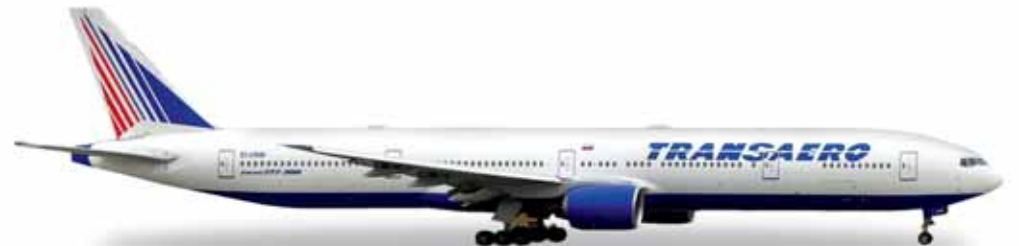
↔ 14,8 cm M 1/500