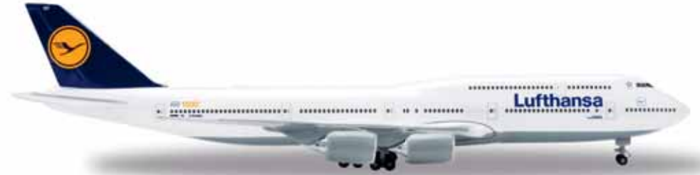
↔ 15,3 cm M 1/500