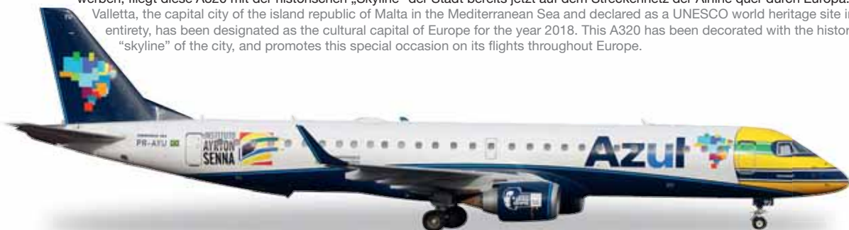
← 19,3 cm (K) 1/200

557023 Air Malta Airbus A320 – 9H-AEO "Valletta - European Capital of Culture 2018" 2018 wird Valletta, die zum UNESCO Weltkulturerbe zählende Hauptstadt der Inselrepublik Malta, Kulturhauptstadt Europas. Um dafür zu werben, fliegt diese A320 mit der historischen „Skyline“ der Stadt bereits jetzt auf dem Streckennetz der Airline quer durch Europa. / Valletta, the capital city of the island republic of Malta in the Mediterranean Sea and declared as a UNESCO world heritage site in its entirety, has been designated as the cultural capital of Europe for the year 2018. This A320 has been decorated with the historic "skyline" of the city, and promotes this special occasion on its flights throughout Europe.