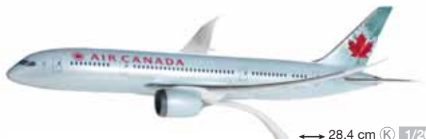
610506 Air Canada Boeing 787-8 Dreamliner – C-GHPQ ↔ 28,4 cm K 1/200 19,50 €

Kunststoff-Steckmodelle mit Stand / Plastic push-fit models with stand