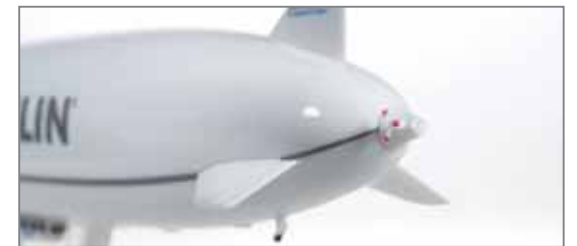
↔ 15,0 cm K F 1/500