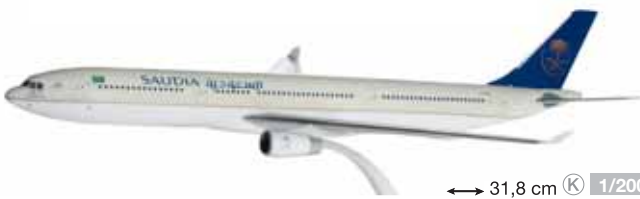
610490 Saudia Airbus A330-300 – HZ-AQA ↔ 31,8 cm K 1/200 18,50 €