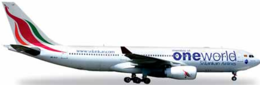
↔ 11,8 cm M 1/500