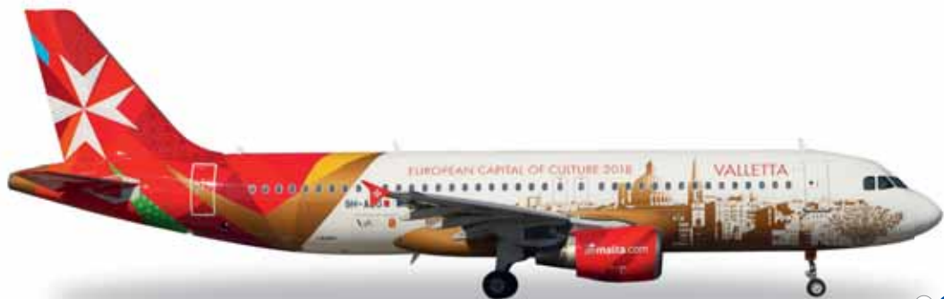
← 18,8 cm (K) 1/200

557023 Air Malta Airbus A320 – 9H-AEO "Valletta - European Capital of Culture 2018" 2018 wird Valletta, die zum UNESCO Weltkulturerbe zählende Hauptstadt der Inselrepublik Malta, Kulturhauptstadt Europas. Um dafür zu werben, fliegt diese A320 mit der historischen „Skyline“ der Stadt bereits jetzt auf dem Streckennetz der Airline quer durch Europa. / Valletta, the capital city of the island republic of Malta in the Mediterranean Sea and declared as a UNESCO world heritage site in its entirety, has been designated as the cultural capital of Europe for the year 2018. This A320 has been decorated with the historic "skyline" of the city, and promotes this special occasion on its flights throughout Europe.