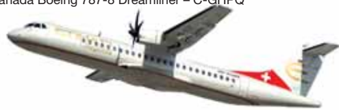
610483 Etihad Regional (Darwin Airline) ATR-72-500 – HB-ACB ↔ 27,2 cm K 1/100 22,00 €