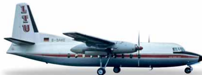
← 12,5 cm (M) 1/200

556668 US Navy Grumman E-2C Hawkeye, VAW-126 "Seahawks" – 165648 / 603 Vier Exemplare der E-2 sind auf jedem Flugzeugträger der US-Marine stationiert, um eine lückenlose Überwachung des Luftraums zu ermöglichen. Die 126. Staffel, derzeit auf der USS Harry S. Truman stationiert, trägt auf dem Bug die Farben des Namensvetters aus der US-Football-Liga NFL, der Seattle Seahawks, die 2014 den Superbowl gewannen. Four E-2s are stationed on each aircraft carrier of the fleet to ensure a continuous 24-hour coverage. The 126th Squadron, currently deployed on the USS Harry S. Truman, carry the colors of their namesake in the NFL, the Seattle Seahawks, winner of Superbowl XLVIII.