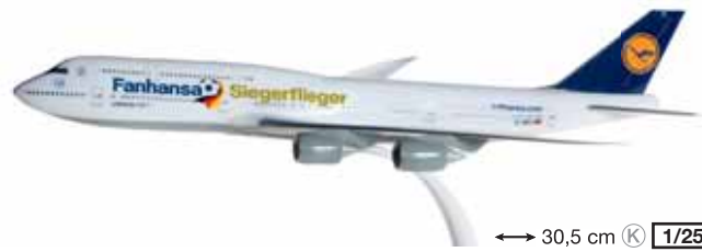
610513 Lufthansa Boeing 747-8 Intercontinental "Fanhansa Siegerflieger" – D-ABYI ↔ 30,5 cm K 1/250 19,50 €