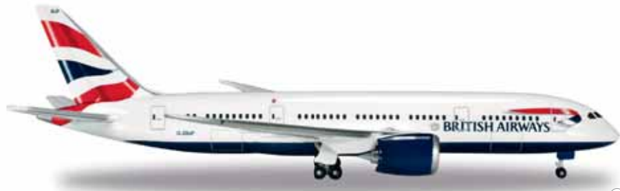
↔ 11,3 cm M 1/500