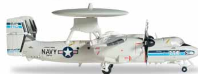
← 8,8 cm (M) 1/200

556668 US Navy Grumman E-2C Hawkeye, VAW-126 "Seahawks" – 165648 / 603 Vier Exemplare der E-2 sind auf jedem Flugzeugträger der US-Marine stationiert, um eine lückenlose Überwachung des Luftraums zu ermöglichen. Die 126. Staffel, derzeit auf der USS Harry S. Truman stationiert, trägt auf dem Bug die Farben des Namensvetters aus der US-Football-Liga NFL, der Seattle Seahawks, die 2014 den Superbowl gewannen. Four E-2s are stationed on each aircraft carrier of the fleet to ensure a continuous 24-hour coverage. The 126th Squadron, currently deployed on the USS Harry S. Truman, carry the colors of their namesake in the NFL, the Seattle Seahawks, winner of Superbowl XLVIII.