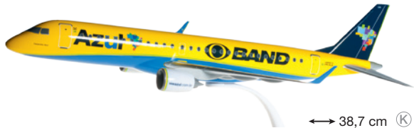
610186 Azul Embraer E195 "Canarinho Azul" – PR-AUA ↔ 38,7 cm K 1/100 19,50 €

Kunststoff-Steckmodelle mit Stand / Plastic push-fit models with stand