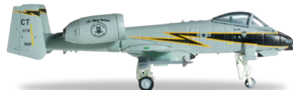
↔ 8,1 cm (M) 1/200 32,00 €

Am 14. August 1974 hob die P.01, der erste Prototyp des Tornado, vom bayerischen Manching zum Erstflug ab. Aus Anlaß des 40. Jubiläums erscheint in limitierter Auflage die P.01 im Maßstab 1:200. / On August 14, 1974, the P.01, the first prototype of the Tornado multirole combat aircraft took off for its maiden flight from the Bavarian town of Manching. To commemorate the 40th anniversary, P.01 will be released as a limited edition item in 1/200.