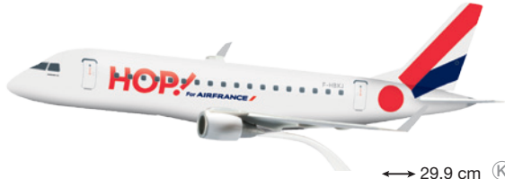
610223 Hop! for Air France Embraer E170 – F-HBXJ ↔ 29,9 cm K 1/100 19,00 €