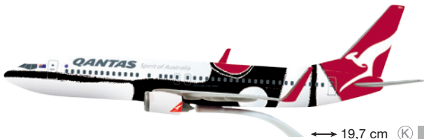
610247 Qantas Boeing 737-800 "Mendoowoorjij" – VH-XZJ ↔ 19,7 cm K 1/200 19,00 €