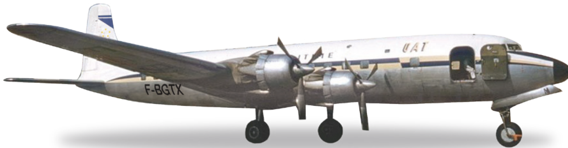
↔ 17,9 cm (M) 1/200 59,00 €

Zusammen mit dem Großteil der 82. Heeresflieger-Brigade war das Dritte Bataillon mit seinem Chinook Transport-Hubschraubern wiederholt als Teil der Operation Enduring Freedom in Afghanistan stationiert. / Together with most of the remaining 82nd Army Aviation Brigade, the 3rd Battalion with its Chinook heavy-lifting capabilities has been deployed to Afghanistan as part of Operation Enduring Freedom on several occasions.