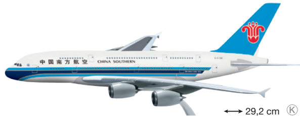
610193 China Southern Airlines Airbus A380-800 – B-6136 ↔ 29,2 cm K 1/250 19,50 €