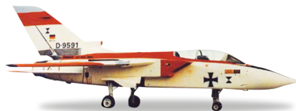
↔ 8,4 cm (M) 1/200 32,00 €