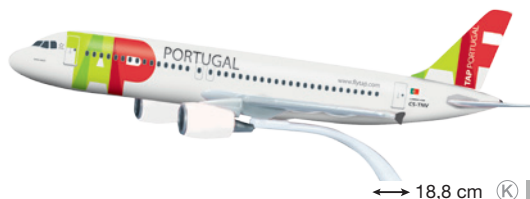
610209 TAP Air Portugal Airbus A320 – CS-TNV ↔ 18,8 cm K 1/200 16,50 €