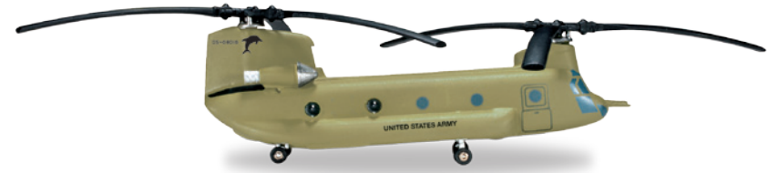
↔ 15,1 cm (M) 1/200 35,00 €

2011 startete Virgin Australia eine Zusammenarbeit mit der Regional-Airline Skywest, welche dann ab 2013 komplett übernommen wurde und nunmehr unter der Virgin-Marke als Virgin Australia Regional Airlines firmiert. / Virgin Australia started a cooperation with domestic Skywest Airlines. A 100% purchase of Skywest followed in 2013 after which the airline now operates fully under the Virgin brand as Virgin Australia Regional Airlines.