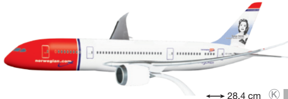
610216 Norwegian Air Shuttle Boeing 787-8 Dreamliner – EI-LNA ↔ 28,4 cm K 1/200 19,00 €