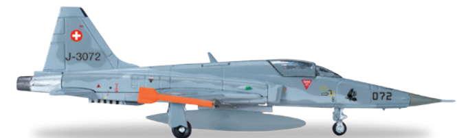
↔ 7,2 cm (M) 1/200 28,00 €

Die "Flying Yankees" wurden bereits 1917 während des Ersten Weltkrieges ins Leben gerufen. Ursprünglich als Sonderlackierung zu ihrem 80. Jubiläum als Einheit der Nationalgarde 2003 lackiert, wurde der schwarze Blitz noch viele weitere Jahre beibehalten. / The "Flying Yankees" trace their origin back to the 118th Aero Squadron formed in 1917 during World War I. Initially painted to commemorate their 80th anniversary as a National Guard unit in 2003, the aircraft continued to fly with the black lightning design long after.