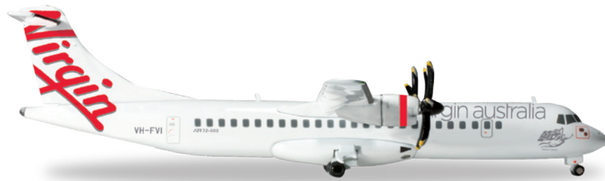
↔ 13,6 cm (M) 1/200 49,50 €