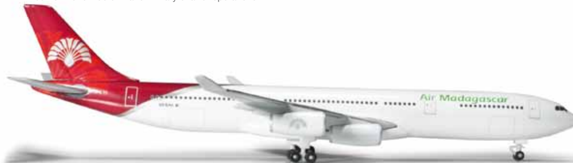
524889 Air Madagascar Airbus A340-300 — 5R-EAA 1/500 26,00 €

2013 integrierte die belgische TUI-Tochter ihre ersten zwei Embraer E-Jets in ihre Flotte. Sie erscheinen bereits in der neuen Bemalung der Airline. / 2013 saw the integration of the first Embraer E-Jets into the fleet of the Belgian TUI subsidiary. Both were delivered in the new color scheme.