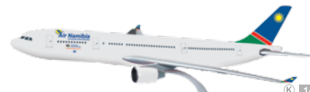
610049 Air Namibia Airbus A330-200 — V5-ANO Modelllänge: 29,4 cm / Model length: 11.6 in