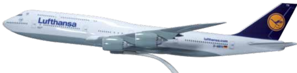
610001 Lufthansa Boeing 747-8 Intercontinental — D-ABYH „Thüringen“ Modelllänge: 30,5 cm / Model length: 12.0 in