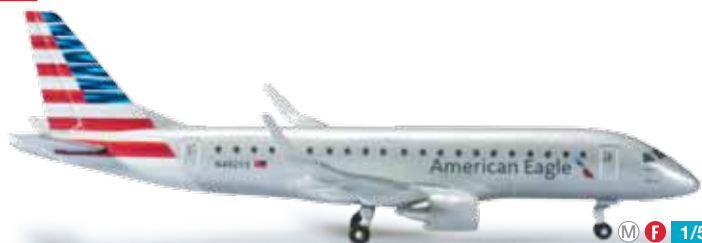
524902 American Eagle (Republic Airlines) Embraer E175 — N402YX 1/500 21,00 €

Formneuheit! Dieses Modell ist nicht nur die erste Embraer 175 im Maßstab 1:500, sondern gleichzeitig auch das erste Modell der American Eagle im neuen Outfit. / New mold! Not only is this the first release of an Embraer in 1/500, but also the first model of American Eagle in the new livery.