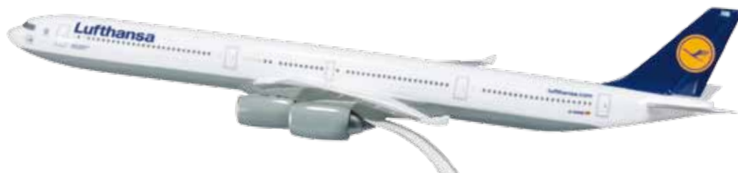
610025 Lufthansa Airbus A340-600 — D-AIHB „Bremerhaven“ Modelllänge: 30,1 cm / Model length: 11.8 in