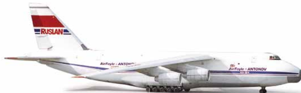
524865 Air Foyle / Antonov Airlines AN-124 — CCCP-82008 1/500 32,00 €

Formneuheit! Dieses Modell ist nicht nur die erste Embraer 175 im Maßstab 1:500, sondern gleichzeitig auch das erste Modell der American Eagle im neuen Outfit. / New mold! Not only is this the first release of an Embraer in 1/500, but also the first model of American Eagle in the new livery.