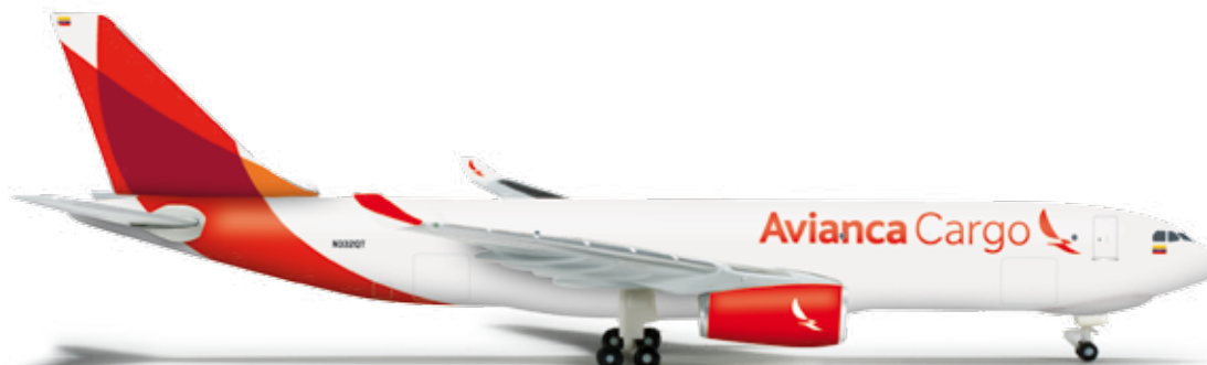
526180 Avianca Cargo Airbus A330-200F — N332QT 1/500 26,00 €

Formneuheit! Zurzeit ist die jordanische Airline die einzige Fluggesellschaft im Nahen Osten, die diese längste Version der E-Jet-Familie des brasilianischen Herstellers Embraer betreibt. / New mold! Currently, the Jordanian airline is the only operator of the longest variant of the E-Jet family developed by the Brazilian manufacturer Embraer in the Middle East.