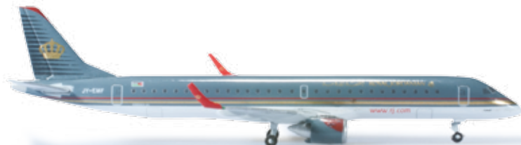
524940 Royal Jordanian Airlines Embraer E195 — JY-EMF „Petra“ 1/500 21,50 €

Um ihre Langstreckenziele weiter bedienen zu können, hat die nationale Airline des Inselstaates zwei A340s geleast und mit ihrer originellen Bemalung versehen. / In order to uphold its long-distance flights, the national airline of Madagascar has leased two A340s and adorned them with their exotic color scheme.