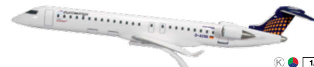
608565-001 Eurowings Bombardier CRJ-900 — D-ACNR Modelllänge: 26,8 cm / Model length: 10.6 in