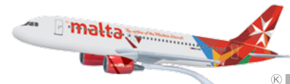
610032 Air Malta Airbus A320 — 9H-AEQ Modelllänge: 18,8 cm / Model length: 7.4 in