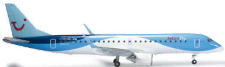
524926 Jetairfly Embraer E190 — OO-JEM „Explorer“ 1/500 21,50 €

Ab 1989, also noch zu Zeiten der Sowjetunion, wurde die britische Chartergesellschaft Air Foyle der alleinige Verkaufsagent für den Flugzeughersteller Antonov und vermarktete fortan deren AN-124 Flotte für den weltweiten zivilen und militärischen Einsatz. / In 1989, during the last years before the dissolution of the Soviet Union, the British charter airline became the sole sales agent for the Antonov Design Bureau and marketed its AN-124 fleet for worldwide civil and military charter operations.