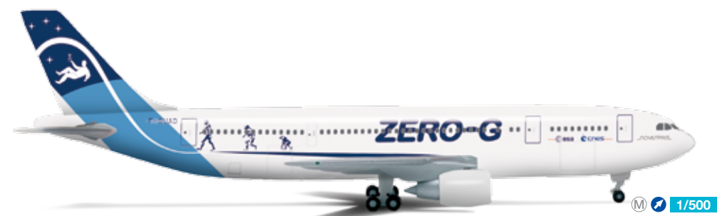
524766 Novespace „Zero G“ Airbus A300B2 – F-BUAD Für Trainings- und Forschungszwecke betreibt das Unternehmen Novespace diesen Airbus A300 und führt im Auftrag französischer und europäischer Raumfahrtbehörden Parabelflüge zur Simulation der Schwerelosigkeit durch. / The company Novespace operates this Airbus A300 for French and other European aerospace agencies, simulating a reduced-gravity environment for training and research purposes. 26,00 €