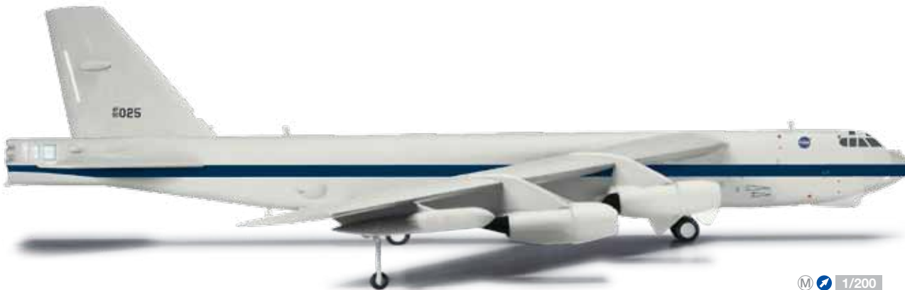
556293 NASA Dryden Research Center Boeing NB-52H Stratofortress – 61-0025 2001 übernahm die Weltraumbehörde NASA ein Exemplar dieses strategischen Bombers von der US-Luftwaffe als Trägerflugzeug zur Erprobung neuer experimenteller Prototypen. Luft- und Raumfahrzeuge bis zu einem Gewicht von mehr als elf Tonnen konnten so in die Luft getragen und dann ausgeklinkt werden. / NASA obtained a B-52H strategic bomber from the U.S. Air Force in 2001, for use as a carrier for experimental test bed aircraft. Aerospace vehicles up to a weight of eleven tons (25,000 lb) can be carried into the air and then launched.