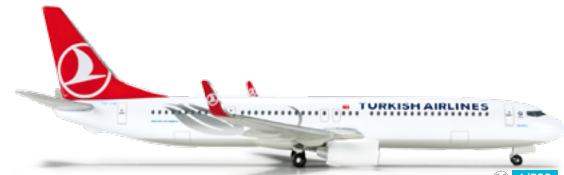
524797 Turkish Airlines Boeing 737-900 – TY-JYE „Tuz Gölü“