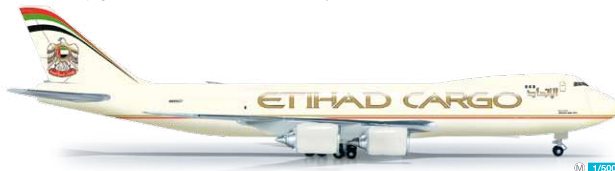
524711 32,00 € Etihad Cargo Boeing 747-8F – N855GT