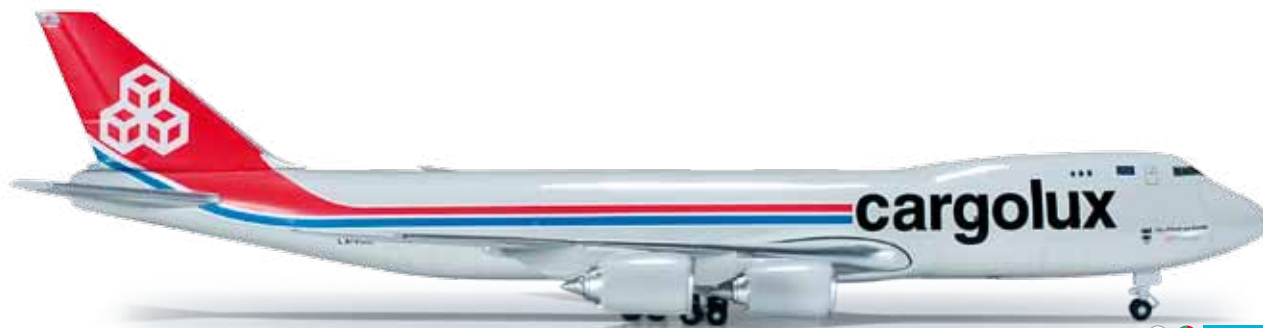
519199-001 Cargolux Boeing 747-8F Neue Registration / New registration: LX-VCD „City of Luxembourg“