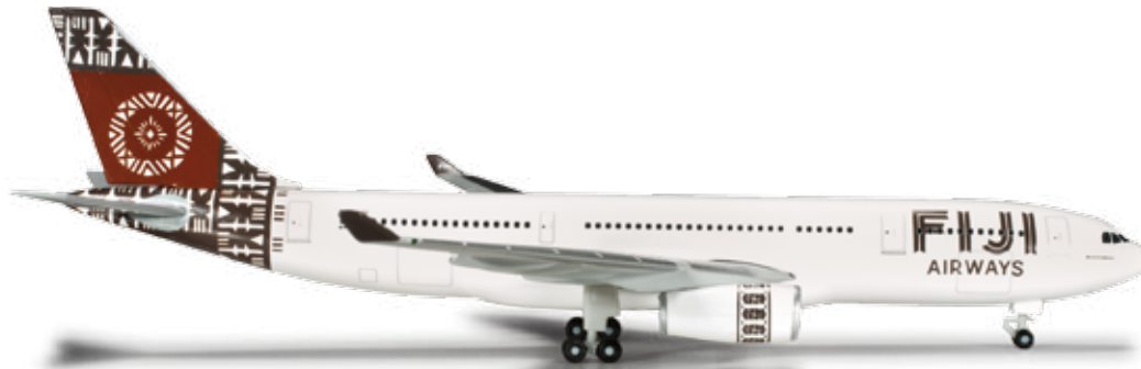
524728 Fiji Airways Airbus A330-200 – DQ-FJU „Island of Namukalau“ Mit der Auslieferung ihrer ersten beiden Airbus A330, die die betagten 747 ersetzen werden, verpasste sich Air Pacific einen komplett neuen, sehr attraktiven Auftritt samt neuem Namen. / Simultaneously with the delivery of its first two Airbus A330s that are replacing the venerable 747s, Air Pacific underwent a radical modernization with a completely new and attractive visual appearance also including a new name.