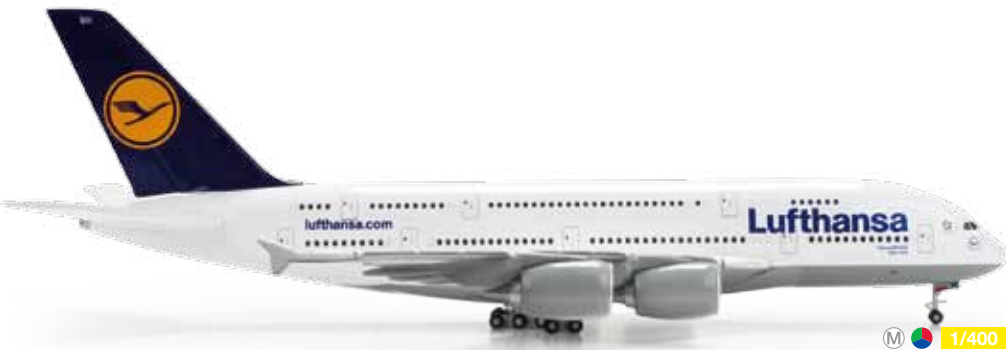
561068-001 Lufthansa Airbus A380 Neue Registration / New registration: D-AIMH „New York“ 39,50 €