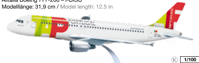
609913 TAP Air Portugal Airbus A320 – CS-TNV Modelllänge: 37,6 cm / Model length: 14.8 in