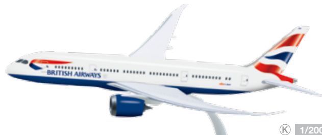
609838 British Airways Boeing 787-8 Dreamliner – G-ZBBJ Modelllänge: 28,4 cm / Model length: 11.2 in