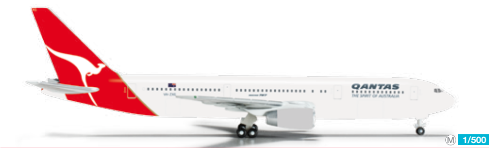
524773 Qantas Boeing 767-300 – VH-ZXG „Karratha“ Die australische Qantas betreibt als eine der wenigen Fluggesellschaften weltweit einige mit Rolls Royce RB211 Triebwerken ausgerüstete Boeing 767, darunter auch die VH-ZXG. / As one of only a handful of airlines worldwide, some of the 767s operated by the Australian airline, such as VH-ZXG, are equipped with Rolls Royce RB211 engines. 26,00 €