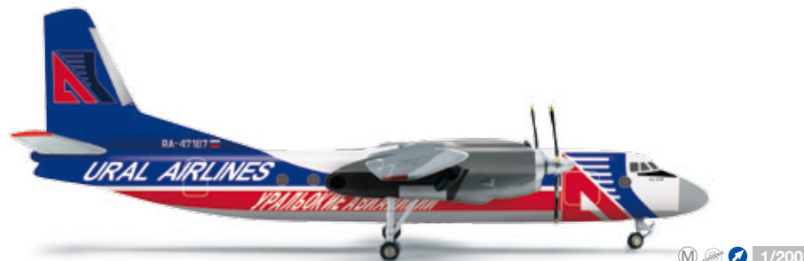
556286 Ural Airlines Antonov AN-24B – RA-47187