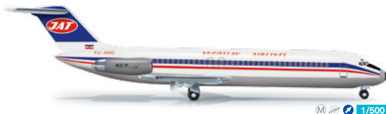
524742 21,00 € JAT - Yugoslav Airlines McDonnell Douglas DC-9-30 – YU-AHO Bis zu dem ab 1991 einsetzenden Auseinanderbrechen des Vielvölkerstaats war JAT die Staatslinie Jugoslawiens. Insgesamt 16 DC-9 wurden in den 1970er und -80er Jahren eingesetzt. / Up until the beginning disintegration of the multiethnic country starting in 1991, JAT was the national carrier of Yugoslavia. A total of 16 DC-9s were operated in the 1970s and '80s.