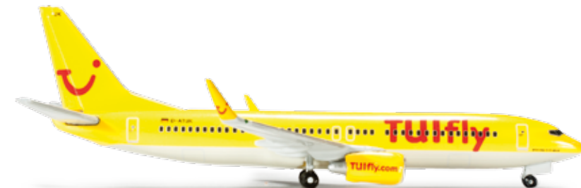
505864-001 TUfly Boeing 737-800 Neue Registration / New registration: D-ATUK