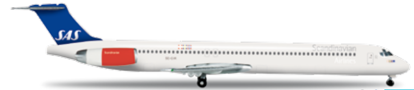
524780 SAS Scandinavian Airlines McDonnell Douglas MD-81 – SE-DIR „Nora Viking“