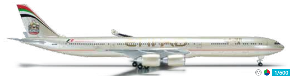
523998-001 Etihad Airways Airbus A340-600 Neue Registration / New registration: A6-EHK 26,00 €