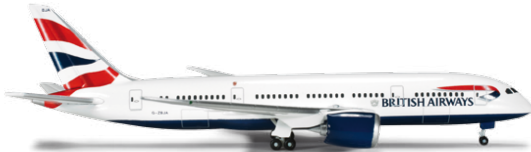
524698 British Airways Boeing 787-8 Dreamliner – G-ZBJA