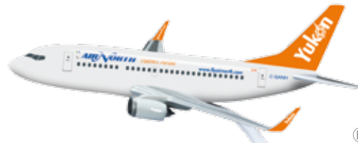
609937 Air North Boeing 737-500 mit / with Winglets – C-GANH Modelllänge: 17,2 cm / Model length: 6.8 in

Kunststoff-Steckmodelle mit Stand / Plastic push-fit models with stand