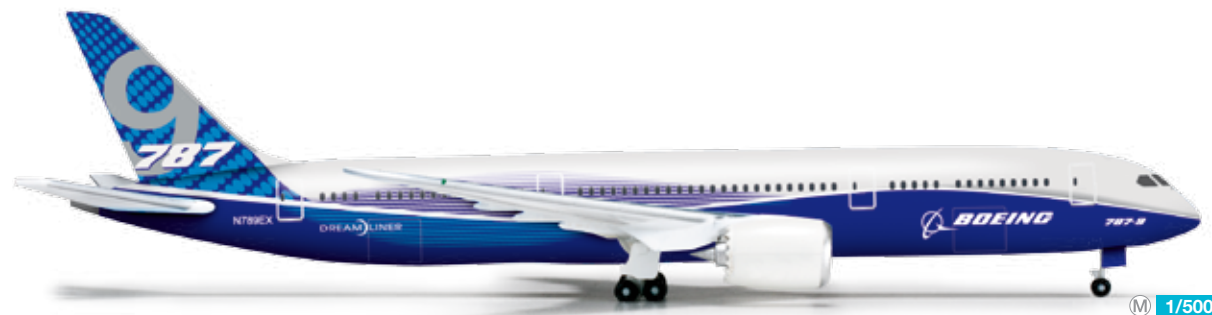
526173 26,00 € Boeing 787-9 Dreamliner Roll-out Livery – N789EX Ende Juli 2013 rollte Boeing den ersten Dreamliner mit dem um sechs Meter verlängerten Rumpf aus der Lackierhalle. Ab Herbst wird das Flugzeug mit dem sechsmonatigen Testflugprogramm beginnen. Mitte 2014 sollen die ersten Exemplare ausgeliefert werden. / The first Dreamliner with the 20 foot (6 m) fuselage stretch was rolled out of the Boeing paint hangar at the end of July, 2013. Starting fall, the aircraft will commence a six-month test program. The first aircraft are scheduled to be delivered by mid 2014.