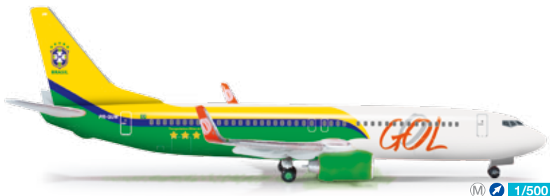
524735 22,00 € GOL Linhas Aereas Boeing 737-800 – PR-GUM „Brazil National Football“ Pünktlich zur Austragung des FIFA Confederations Cups im Sommer 2013 stellte die brasilianische GOL diese Maschine mit den Farben des nationalen Fußballverbands vor. Bis nach der Fußball-Weltmeisterschaft 2014 wird diese 737 weiter Stimmung für das eigene Team machen. / In time for the hosting of the FIFA Confederations Cup in the summer of 2013, the Brazilian airline introduced this aircraft in the colors of the national soccer association. The 737 will continue to root for the home team until after the soccer world cup in 2014.