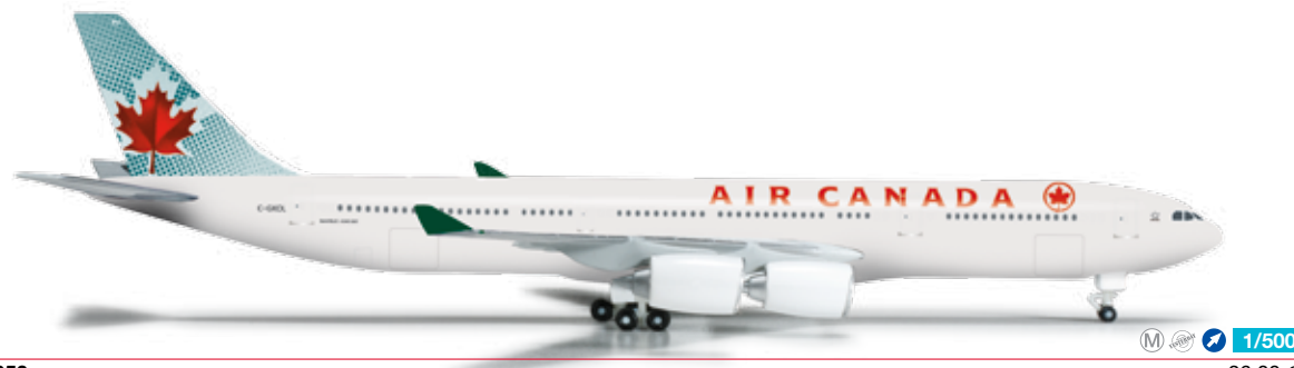
524650 26,00 € Air Canada Airbus A340-500 – C-GKOL Vor dem Verkauf des Ultralangstrecken-Airbusses wurde zumindest noch das Leitwerk der C-GKOL im neuen frischen Design der kanadischen Airline lackiert. / For a short time before selling off these ultra long-range Airbus aircraft, C-GKOL flew in a hybrid scheme with the fresh new design of the Canadian airline applied to its rudder.