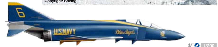
556316 US Navy „Blue Angels“ McDonnell Douglas F-4J Phantom II – No. 6 Von 1969 bis 1974 flog die Kunstflugstaffel der US Marine die relativ große F-4 Phantom II in ihren Formations- und Solovorführungen. Beginnend mit dem Nummer 6-Flugzeug (Solo Position) wird Herpa alle sechs Flugzeuge der Staffel nacheinander in einmaligen und streng limitierten Auflagen anbieten. / From 1969 to 1974, the aerobatic team of the US Navy used the large F-4 Phantom II for their aerial displays and stunts. Starting with the number 6 solo position aircraft, Herpa will be offering all six aircraft of the team, one after the other, in strictly limited, one-time only production runs.