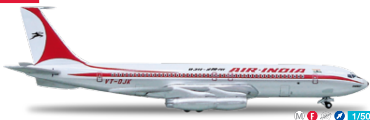
524681 24,50 € Air India Boeing 707-400 – VT-DJK „Everest“ Formneuheit! Die 707 der 400er Serie sind äußerlich an der Verwendung von Rolls Royce Conway-Triebwerken und einer zusätzlichen Kielflosse zur erhöhten Stabilität zu erkennen. Air India war einer von sechs ursprünglichen Kunden dieser Variante, die sie ab 1960 einsetzte. / New mold! The 707s of the -400 series can be externally recognized by the use of Rolls Royce Conway engines and the addition of a ventral fin for increased stability. Air India was one of the original six airliners to order this variant, having first started operations from 1960.