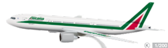
609944 Alitalia Boeing 777-200 – I-DISU Modelllänge: 31,9 cm / Model length: 12.5 in