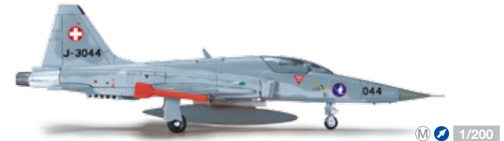
556309 Swiss Air Force Northrop F-5E Tiger II, Fliegerstaffel 19, Sion Air Base – J-3044