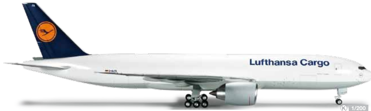
556194 Lufthansa Cargo Boeing 777 Freighter – D-ALFA