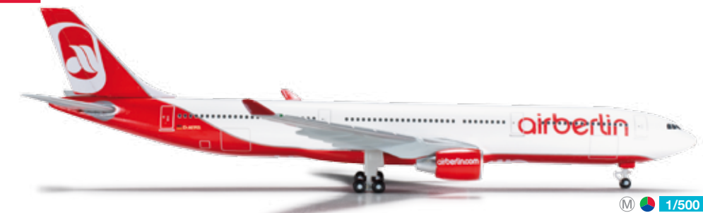
524056-001 Air Berlin Airbus A330-300 Neue Registration / New registration: D-AERS 26,00 €