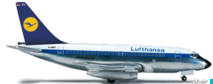
524759 Lufthansa Boeing 737-100 – D-ABEC „Osnabrück“