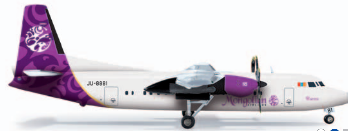
555548 Mongolian Airlines Fokker 50 M 1/200 48,00 €

Von 1994 bis 2008 operierte die schottische Loganair eine große Flotte kleiner Flugzeuge im Zubringerdienst für British Airways. So erhielten auch ab 1997 einige Flugzeuge der Loganair, wie diese Saab 340, die World Images Bemalungen am Leitwerk. Ebenfalls im Herpa Programm: Art.-Nr. 555173 British Airways World Cargo Boeing 747-8F / From 1994 to 2008, the Scottish Loganair operated a large fleet of small airplanes in feeder service for British Airways. From 1997, some Loganair planes – like this Saab 340 – were decorated with the World Images livery on the tail unit. Also available: Item no. 555173 British Airways World Cargo Boeing 747-8F