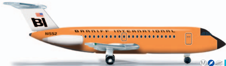
523677 19,00 € Braniff International BAC 1-11-200 1967 verpasste die Airline aus Texas ihren Flugzeugen mit knalligen Farben ein neues Design. Herpa startet mit einer BAC 1-11 in „Jelly Bean Orange“. / In 1967, the Texan airline gave its airplanes a new design with loud colors. Herpa begins with a BAC 1-11 in „Jelly Bean Orange“.