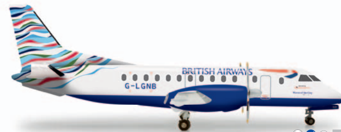
555586 British Airways (Loganair) Saab 340 „Waves of the City“ M 1/200 42,00 €

Der auf dem Flugplatz Birrfeld zwischen Zürich und Basel beheimatete Club hat seine in Litauen registrierte AN-2 des Baujahrs 1978 liebevoll restauriert und auf den Namen „Rusalka“ getauft. / The association – based at the airfield Birrfeld between Zurich and Basel – has tenderly restored its AN-2, manufactured in 1978 and registered in Lithuania. The plane was named "Rusalka".