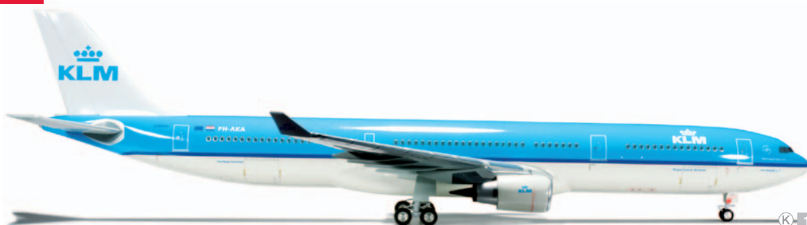
555494 KLM Airbus A330-300 K 1/200 64,00 €

Als erste A330-300 wurde die "Times Square – New York" Anfang 2012 in Dienst gestellt. Die insgesamt vier Flugzeuge werden in der Hauptsache die Strecken von Amsterdam nach Washington D.C., Nigeria und Ghana bedienen. / The first A330-300 to be commissioned in the beginning of 2012 was the "Times Square – New York". Four planes altogether are scheduled to mainly fly on the routes from Amsterdam to Washington D.C., Nigeria and Ghana.