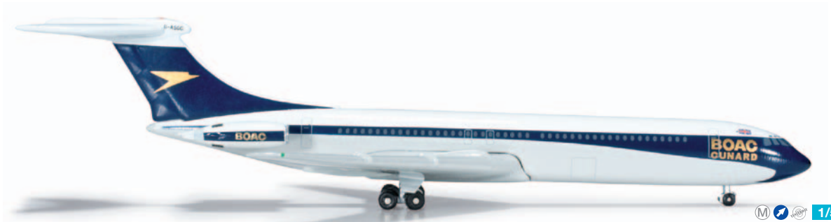
523684 26,00 € BOAC-Cunard Vickers Super VC10 Vor 50 Jahren startete erstmals die britische VC-10. Zum Jubiläum erscheint in limitierter Auflage eine Super VC-10, die von BOAC in Kooperation mit der Reederei Cunard betrieben wurde und heute im Imperial War Museum in Duxford bei London ausgestellt ist. / 50 years ago, the British VC-10 took off for the first time. For the anniversary, a limited edition Super VC-10 is released, which BOAC operated in cooperation with the shipowning company Cunard which is today exhibited at the Imperial War Museum in Duxford near London.