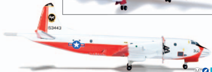
523752 21,50 € US Navy VX-30 „Bloodhounds“ Lockheed NP-3D Orion Die VX-30 testet neue Waffen- und Elektroniksysteme. Hierzu verwenden die „Bluthunde“ auch mit neuen Sensoren ausgestattete Orion-Patrouillenflugzeuge. / VX-30 is tasked with evaluating new weapon and electronic systems. Among other types, the „Bloodhounds“ operate Orion patrol aircraft equipped with special sensors and instrumentation.