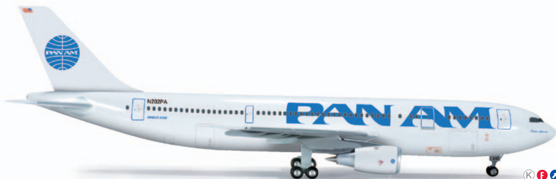
555424 Pan Am Airbus A300B4 K F 1/200 62,00 €

Als erste A330-300 wurde die "Times Square – New York" Anfang 2012 in Dienst gestellt. Die insgesamt vier Flugzeuge werden in der Hauptsache die Strecken von Amsterdam nach Washington D.C., Nigeria und Ghana bedienen. / The first A330-300 to be commissioned in the beginning of 2012 was the "Times Square – New York". Four planes altogether are scheduled to mainly fly on the routes from Amsterdam to Washington D.C., Nigeria and Ghana.