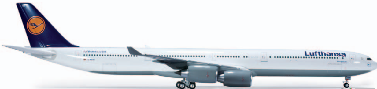
550901-001 Lufthansa Airbus A340-600 K 1/200 66,00 €

Ab 1984 wurden die ersten Airbus-Flugzeuge an Pan Am ausgeliefert, mit der auch die ultimative Bemalung der Fluggesellschaft, die "Billboard Colors", eingeführt wurden. "Clipper America" und die anderen 12 A300 ersetzten zumeist veraltete Boeing 727. / From 1984, the first Airbus airplanes were delivered to Pan Am with which the airline also introduced its ultimate "Billboard" livery. "Clipper America" and the other twelve A300s mostly replaced obsolete Boeing 727.