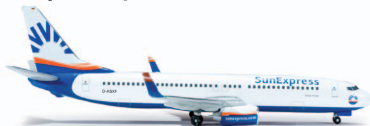
519090-001 Sun Express Boeing 737-800 Neue Registration / New registration: D-ASXF Notausstiegsmarkierungen auf Tragflächen ergänzt. / Wings exit markings added.