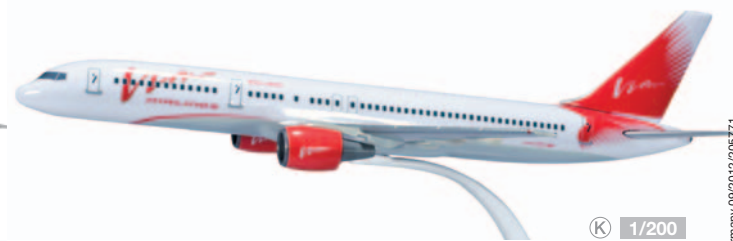
609609 Vim Airlines Boeing 757-200 Modelllänge: 23,7 cm / Model length: 9.3 in