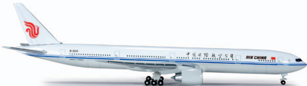
518994-001 Air China Boeing 777-300ER Neue Registration / New registration: B-2031 Notausstiegsmarkierungen auf Tragflächen ergänzt. / Wings exit markings added.