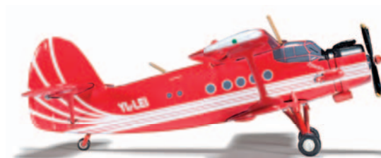
555500 Antonov Club Avianna Antonov AN-2 M 1/200 35,00 €

Neue Registration / New registration: D-AIHI „Mönchengladbach“