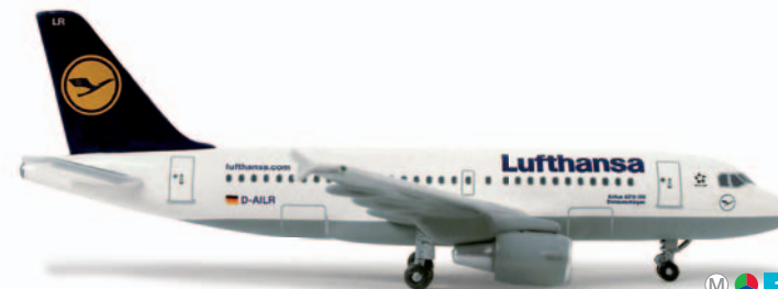
518031-001 Lufthansa Airbus A319 Neue Registration / New registration: D-AILR