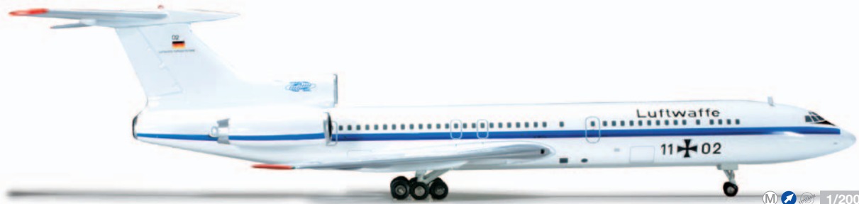
555456 1/200 56,00 €