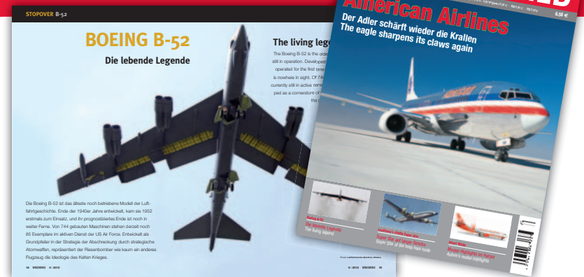
205610 Die neue Ausgabe WingsWorld / The new issue WingsWorld In Ausgabe 5/12 lesen Sie / Some of the topics in issue 5/12: • Titelstory: American Airlines • Stopover: Lockheed L-1649A: Super Star auf langer Strecke / Super Star of the long-haul route • Stopover: Boeing B-52: Die lebende Legende / The living legend Abonnieren Sie jetzt WingsWorld ab 36,00 Euro pro Jahr: Subscribe to WingsWorld starting at 36 Euro annually: www.herpa.de/magazine