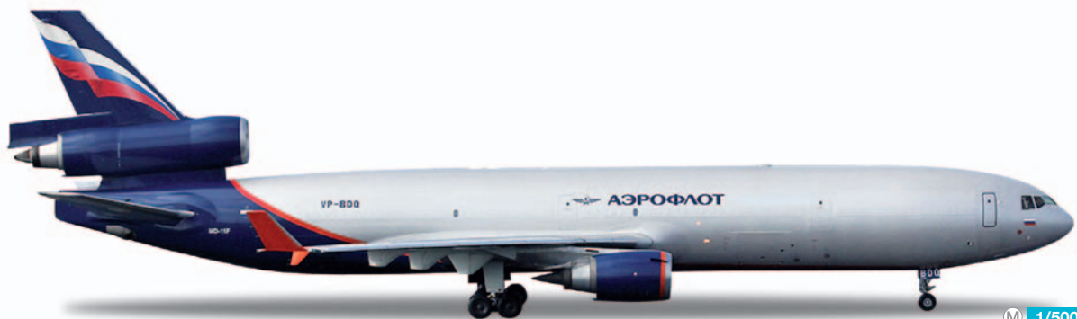
523653 Aeroflot McDonnell Douglas MD-11F Drei zu Frachtern umgebaute MD-11 betreibt Aeroflot überwiegend auf einer Ost-West Route zwischen Ostasien und Westeuropa mit Zwischenlandung in Russland. Ebenfalls im Herpa Programm: Art.-Nr. 515399 Aeroflot Ilyushin IL-86 / Aeroflot operates three MD-11s, converted to cargo planes, mainly on an east-west route between East Asia and Western Europe with stopover in Russia. Also available: Item no. 515399 Aeroflot Ilyushin IL-86