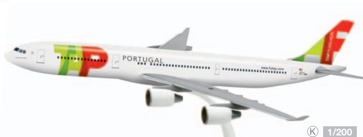
609593 TAP Air Portugal Airbus A340-300 Modelllänge: 31,8 cm / Model length: 12.5 in