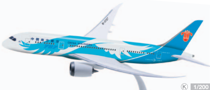
609586 China Southern Airlines Boeing 787-8 Dreamliner Modelllänge: 28,4 cm / Model length: 11.2 in

Kunststoff-Steckmodelle mit Stand / Plastic push-fit models with stand