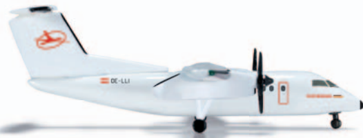
523806 19,00 € Interflug Dash 8-100 Eine kleine Rarität: Ab November 1990 mietete Interflug eine farbikneue DHC-8-100 der Tyrolean Airways zum Einsatz auf Kurzstrecken. / A little rarity: In November 1990, Interflug leased a brand-new DHC-8-100 from Tyrolean Airways for operations on short-haul routes.