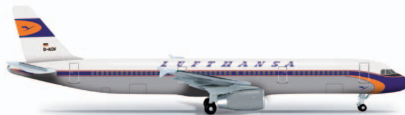
523820 Lufthansa Retro Airbus A321

Die werksneue D-AIDV löst nach sieben Jahren die D-AIRX als Träger der eleganten Retro-Bemalung ab. Das neue Flugzeug weist im Unterschied zum ersten Retrojet eine silberne Rumpflackierung auf. / After seven years, the brand-new D-AIDV replaced D-AIRX as carrier of the elegant retro livery. Contrary to the first retro jet, the new airplane features a silver fuselage.