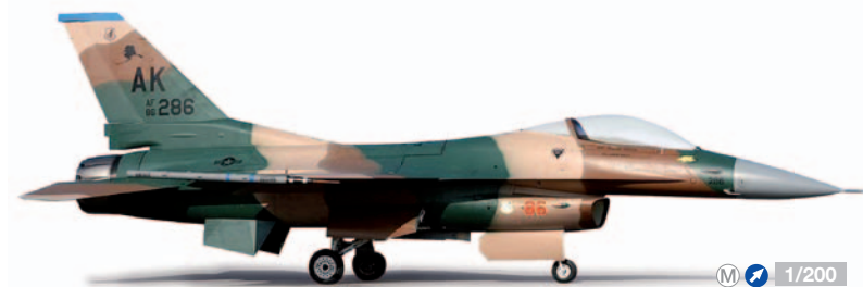
555579 1/200 32,00 €

In 1912, the squadron celebrated its anniversary with a special livery in the unit's colors, also sporting its two emblems on the stabilizer and dorsal air break. Also available: Item no. 552028 RAF Typhoon, No. 29 Squadron