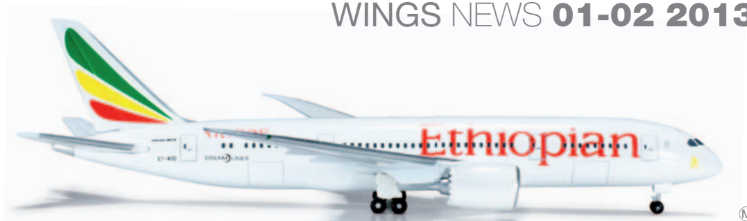
523790 26,00 € Ethiopian Airlines Boeing 787-8 Dreamliner August 2012 konnte Ethiopian als erste Fluggesellschaft Afrikas ihren ersten Dreamliner übernehmen. Zunächst wird die „Africa First“ von Addis Abeba nach Frankfurt und London unterwegs sein. / In August 2012, Ethiopian was the first African airline to commission its first Dreamliner. In the beginning, „Africa First“ will be en route from Addis Abeba to Frankfurt and London.