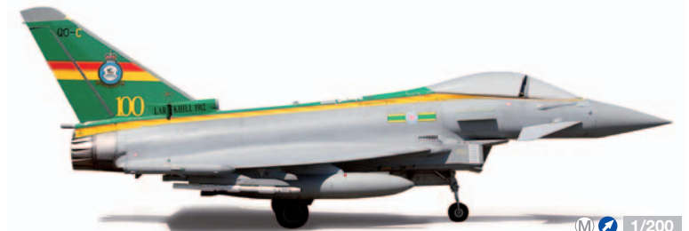
555562 1/200 32,00 €

Neue Registration / New registration: F-HPJF