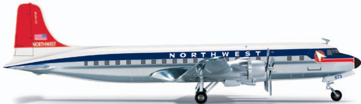
555555 Northwest Orient Airlines Douglas DC-6B Nach dem Zweiten Weltkrieg verlagerte Northwest Airways ihre Bemühungen auf Flügen nach - und auch innerhalb von - Ostasien. Die nunmehr in Northwest Orient umbenannte Airline richtete in Tokio ein erstes im Ausland liegendes Drehkreuz ein. Ab 1954 kamen zahlreiche DC-6 über dem Pazifik zum Einsatz. / After WWII, Northwest Airways shifted its efforts to flights to and also within East Asia. The airline, then named Northwest Orient, established a first foreign hub in Tokyo. From 1954, numerous DC-6s were operated across the Pacific.