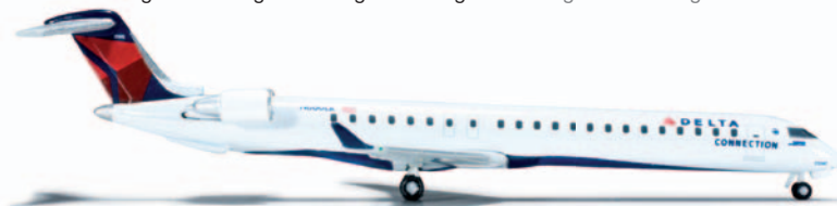
523691 Delta Connection (Pinnacle Airlines) Bombardier CRJ-900 Pinnacle Airlines mit Sitz in Memphis betreibt ihre 140 CRJ-200 und -900 ausschließlich im Zubringerdienst für Delta. / Pinnacle Airlines with headquarters in Memphis operates its 140 CRJ-200s and -900s solely in feeder service for Delta.