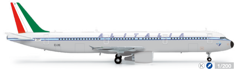
555166 Alitalia Retrojet Airbus A321 1/200 46,00 €

Bis 1954 erhielt Pan Am für das ständig wachsende Langstreckennetz insgesamt 45 Exemplare der DC-6. Teil dieser Order war der Clipper Priscilla Alden, benannt nach einer der ersten Siedlerinnen, die an Bord der Mayflower in der Neuen Welt ankamen. / By 1954, Pan am had taken delivery of a total of 45 DC-6 aircraft for its constantly expanding long distance network. Included in that purchase was the Clipper Priscilla Alden, named after one of the first colonists that arrived in the New World on board the Mayflower.