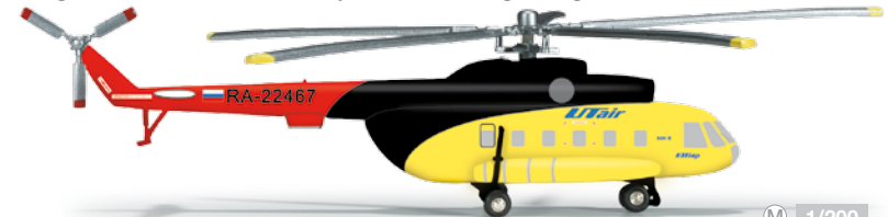
555227 UT Air Mil Mi-8 1/200 34,00 €

Erst 2007 gegründet, bedient die junge malaysische Firefly mit ihrer ausschließlich aus ATR-Turboprops bestehenden Flotte Regionalziele in Malaysia und im benachbarten Ausland. Founded in 2007, the still young Malayan airline with an ATR turboprop-only fleet flies to regional destinations inside Malaysia as well as neighboring countries.