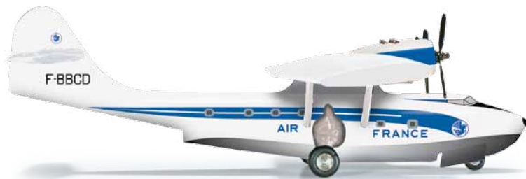
555241 1/200 42,50 €

Airbus Skylink „2“ Super Guppy Turbine 377 SGT Von 1971 bis 1998 beförderten vier Super Guppys im Auftrag von Airbus Großbauteile zwischen den verschiedenen Werken. Heute ist das Original der „Nummer 2“ im Luftfahrtmuseum Ailes Anciennes bei Toulouse ausgestellt. / From 1971 through to 1998, a total of four Super Guppies hauled oversize components between the various Airbus production facilities. Today, the original “Number 2” aircraft is on display at the Ailes Anciennes Aviation Museum near Toulouse, France.