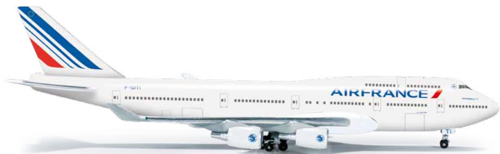
523271 1/500 25,00 €

Neben dem Chartergeschäft betreibt die spanische Airline auch Linienverbindungen. So kommt diese auf den Popstar David Bisbal getaufte A330 hauptsächlich auf den Langstrecken nach Nord- und Südamerika zum Einsatz. / Next to the charter business, the Spanish airline also operates line connections. The A330, named after the pop star David Bisbal, is mainly used on the long-haul routes to North and South America.