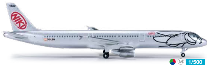
520942-001 1/500 19,50 € Niki Airbus A321 Neue Registration / New registration: OE-LEW „Cancan“