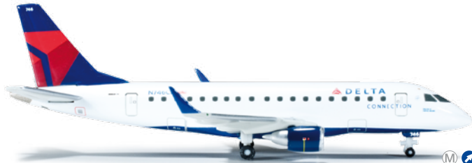
562324 1/400 26,00 €

Delta Connection Embraer ERJ-170 Unter dem Dach von Delta Connection betreiben sieben selbstständige Airlines eine Flotte von über 500 Regionalflugzeugen im Zubringerdienst für Delta. Eine davon ist die in Minneapolis/St.Paul beheimatete Compass Airlines. Seven independent airlines operate a total of more than 500 regional aircraft in feeder service under the Delta Connection name for Delta. One of these carriers is Compass Airlines based in Minneapolis/St.Paul.