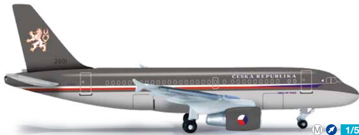
523318 1/500 19,50 € Czech Air Force Airbus A319CJ Zwei moderne A319CJ (Corporate Jet) im attraktiven Design stehen der tschechischen Regierung zur Verfügung. / Two modern A319CJs (Corporate Jets) in this attractive design are readily available for use by the Czech Republic's government.