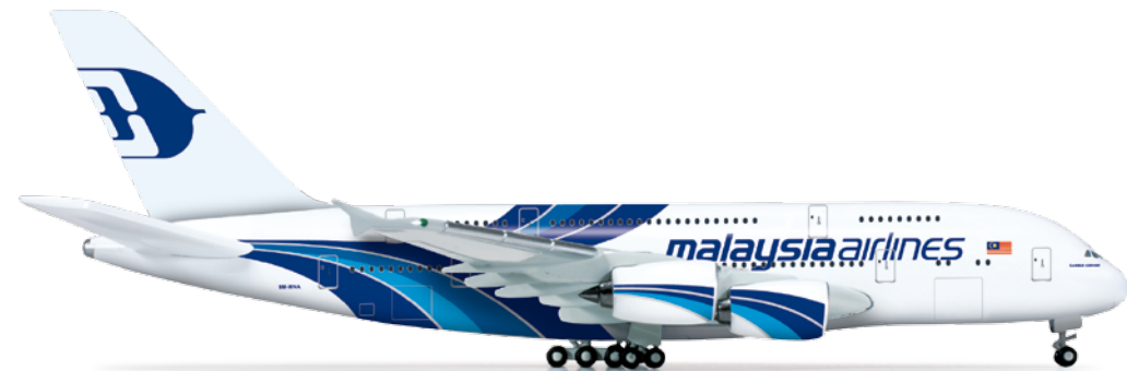
523394 1/500 29,00 € Malaysia Airlines Airbus A380 Im Juli wird die erste A380 ihren Dienst für Malaysia Airlines aufnehmen. Mit der Indienstellung wird auch diese neue, nunmehr in Blautönen gehaltene Farbgebung erstmals eingeführt. / Starting July, the first A380 will be put into service by Malaysia Airlines. At the same time, this new corporate design in various shades of blue will be introduced for the first time.