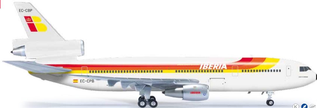
555203 Iberia McDonnell Douglas DC-10-30 1/200 55,00 €

Über 25 Jahre lang blieb die DC-10 bei der spanischen Iberia im Einsatz, hauptsächlich auf den Strecken nach Nord- und Südamerika. Die DC-10-Flotte wurde nach spanischen Küstenregionen benannt, wie zum Beispiel Costa Dorada, mit der Kennung EC-CPB. / For over 25 years, the DC-10 remained in service for the Spanish carrier Iberia, mainly operating on routes to North and South America. The DC-10s were named after Spanish coastal regions, such as Costa Dorada, registered EC-CPB.