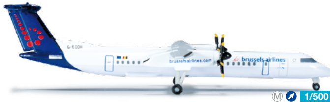
523301 1/500 18,00 € Brussels Airlines Bombardier Q400 Seit März verstärken für mindestens zwei Jahre zwei von FlyBe geleaste Q400 die Flotte der belgischen Airline. / Starting March, two Q400 leased from FlyBe are bolstering the fleet of the Belgian carrier for at least two years.