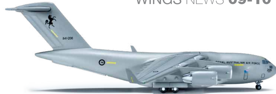
523349 1/500 24,00 € Royal Australian Air Force Boeing C-17A Globemaster Derzeit stehen der 36. Staffel fünf „Globemaster III“ zur Verfügung, die sie in der Vergangenheit bereits häufig für militärische und humanitäre Einsätze von Irak bis zu den samoanischen Inseln in der Südsee einsetzte. / No 36 Squadron currently operates five "Globemaster III" transports, and has frequently deployed them for military and humanitarian missions from Iraq to the Samoan Islands in the South Pacific.