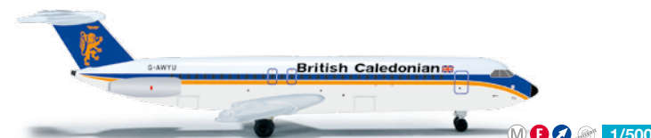
523295 1/500 19,00 €

In der Vielzahl von Retrobemalungen reiht sich nun auch Alitalia mit diesem A321 im Look der 1960er Jahre ein. / Alitalia joins the multitude of retro liveries with this A321 featuring the livery of the 1960s.