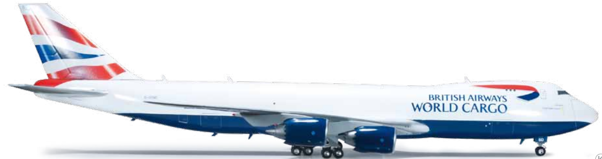
555173 1/200 66,00 €

Air France Consolidated Vultee PB5-A Catalina Zwischen 1947 und 1951 betrieb Air France innerhalb der Karibik drei Catalina Flugboote. F-BBCD war in Fort de France, Hauptstadt von Martinique in den kleinen Antillen stationiert. Between 1947 and 1951, Air France operated three Catalina amphibians in the Caribbean Sea. F-BBCD was stationed in Fort de France, the capital of Martinique in the Lesser Antilles.