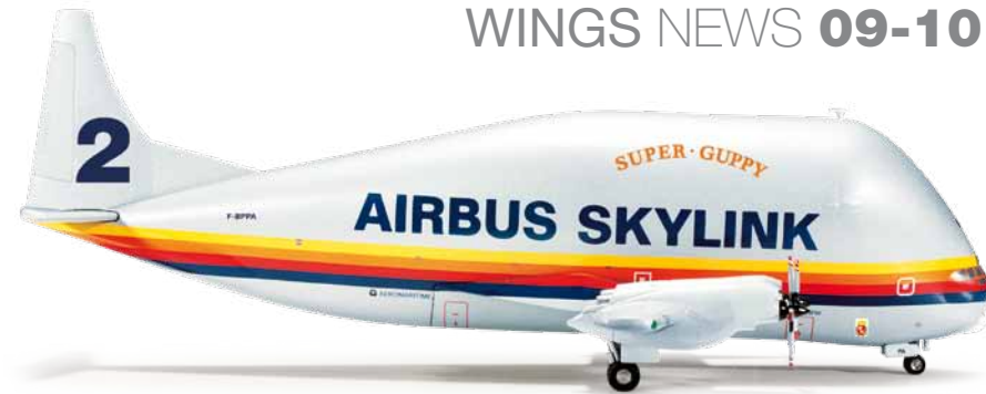
555258 1/200 69,00 €

Delta Connection Embraer ERJ-170 Unter dem Dach von Delta Connection betreiben sieben selbstständige Airlines eine Flotte von über 500 Regionalflugzeugen im Zubringerdienst für Delta. Eine davon ist die in Minneapolis/St.Paul beheimatete Compass Airlines. Seven independent airlines operate a total of more than 500 regional aircraft in feeder service under the Delta Connection name for Delta. One of these carriers is Compass Airlines based in Minneapolis/St.Paul.