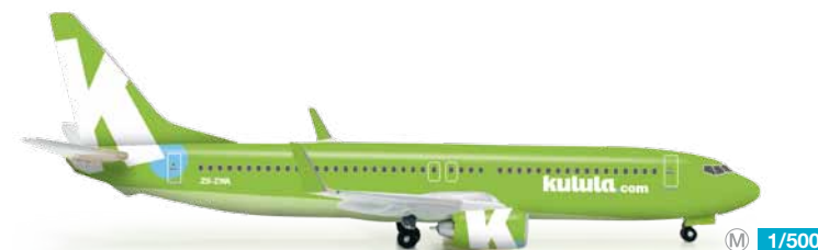
523325 1/500 19,50 €

Seit 1970 betreibt Frankreichs nationale Airline den berühmten Jumbo Jet, angefangen vom Ur-Modell -100 bis zur heutigen -400. Erstmals erscheint die 747-400 in der neuesten Farbgebung bei Herpa. / Since 1970, France's national airline has been operating the famous jumbo jet, starting with the initial -100 to today's -400 series. Herpa premieres the 747-400 in its latest design.