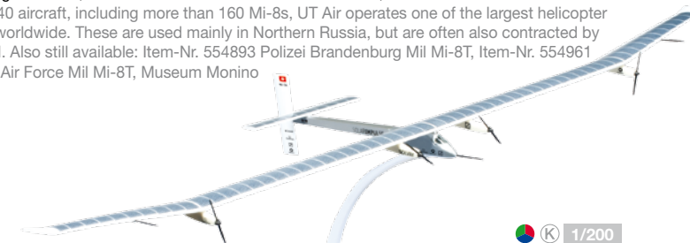
552561-001 Solar Impulse HB-SIA 1/200 34,50 €

Mit mehr als 340 Exemplaren, davon alleine mehr als 160 Mi-8, gehört UT Air zu den größten Hubschrauberbetreibern weltweit. Diese kommen hauptsächlich im nördlichen Russland, aber auch regelmäßig für die UN zum Einsatz. Ebenfalls noch erhältlich: Art.-Nr. 554893 Polizei Brandenburg Mil Mi-8T, Art.-Nr. 554961 Soviet Air Force Mil Mi-8T, Museum Monino / With more than 340 aircraft, including more than 160 Mi-8s, UT Air operates one of the largest helicopter fleets worldwide. These are used mainly in Northern Russia, but are often also contracted by the UN. Also still available: Item-Nr. 554893 Polizei Brandenburg Mil Mi-8T, Item-Nr. 554961 Soviet Air Force Mil Mi-8T, Museum Monino