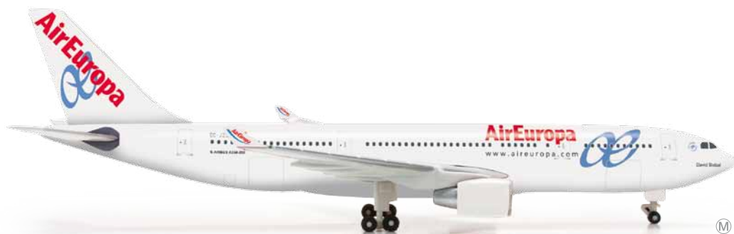
523264 1/500 24,00 €

Aktuelles Flaggschiff der ukrainischen Gesellschaft sind vier Boeing 767, die Kiew mit Nordamerika und Asien verbinden. Diese tragen die neueste Farbgebung der Airline in den gelb-blauen Landesfarben. / Current flagships of the Ukrainian airline are four Boeing 767s which connect Kiev with North America and Asia. The airplanes sport the airline's latest design – the yellow-blue national colors.