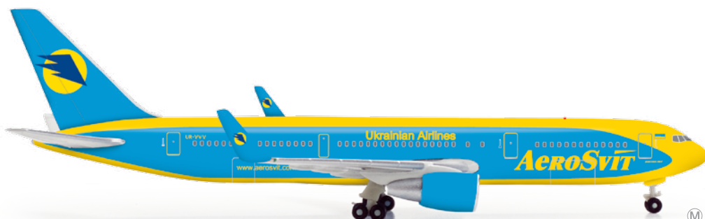
523240 1/500 23,00 €