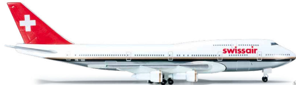
523356 1/500 24,00 € Swissair Boeing 747-300 1983 wurde diese auf die Stadt Basel getaufte 747 im damaligen „Chocolate“-Design mit den braun-schwarzen Streifen an Swissair ausgeliefert. Die 747-300 hatte gegenüber den Vorgängerversionen ein um sieben Meter gestrecktes Oberdeck. / Named for the city of Basel, this 747 was delivered to Swissair in the brown/black-striped "Chocolate"-livery of the time. In comparison to older variants, the 747-300 had its upper deck stretched by seven meters (23 feet).