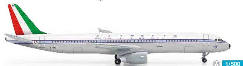
523288 1/500 19,50 €

Im umfangreichen Streckennetz innerhalb Nordamerikas operieren unter anderem zehn A321 in der markanten eisblauen Farbgebung. Ebenfalls noch erhältlich: Art.-Nr. 515870 Air Canada Boeing 777-200LR / Ten A321s in a striking ice-blue design are inter alia operated in the comprehensive route network within North America. Also still available: Item-Nr. 515870 Air Canada Boeing 777-200LR