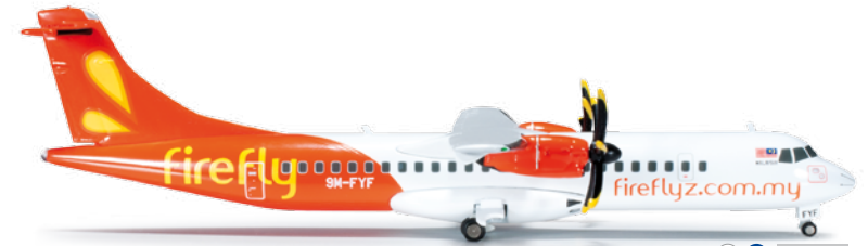
555197 Firefly ATR-72-500 1/200 48,00 €

Parallel zur Ankündigung in 1:500, erscheint auch dieser neueste Retroflieger eine ganze Nummer größer. Die Bemalung bekam den Spitznamen „Pentagramma“, italienisch für die Notenlinien in der Musik, aufgrund der fünf schmalen Streifen am Rumpf. / Simultaneously with the 1/500 scale version, this newest retrojet is also released in a larger size as well. The livery was nicknamed "Pentagramma", Italian for the musical staff, due to the five thin stripes on the fuselage.