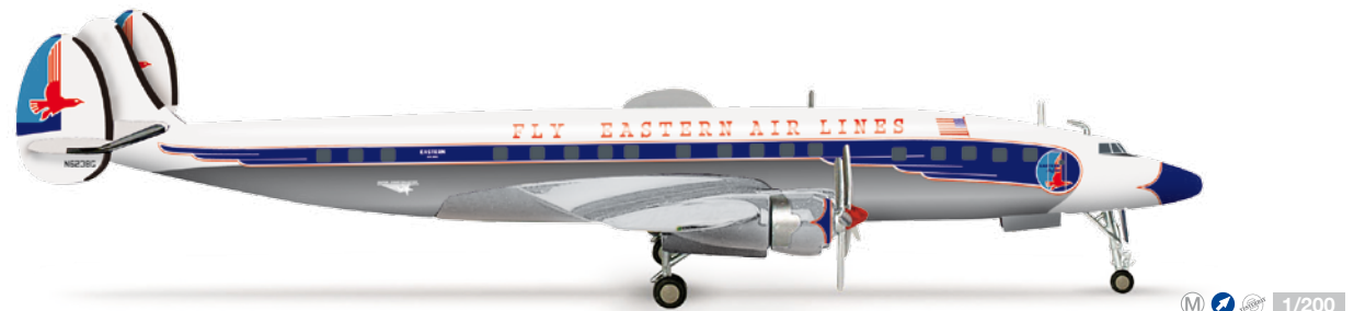
555180 1/200 58,00 €

Air Berlin Bombardier Q400 Neue Registration D-ABQJ. „Operated by LGW“ ergänzt auf linker Seite. Ebenfalls noch erhältlich: Art.-Nr. 554039 Air Berlin Airbus A321 New registration D-ABQJ. “Operated by LGW“ added on left side. Also still available: Item-Nr. 554039 Air Berlin Airbus A321