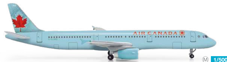
523257 1/500 19,50 €

Zeitgleich mit der Indienstellung von ZS-ZWA im Juli wird auch diese neue Bemalung für die Billigairline aus Südafrika eingeführt. / Simultaneous with the commissioning of ZS-SWA in July, this new corporate identity will be introduced for the South African low-cost carrier.