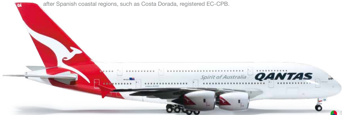
551991-002 Qantas Airbus A380 1/200 69,00 €

Über 25 Jahre lang blieb die DC-10 bei der spanischen Iberia im Einsatz, hauptsächlich auf den Strecken nach Nord- und Südamerika. Die DC-10-Flotte wurde nach spanischen Küstenregionen benannt, wie zum Beispiel Costa Dorada, mit der Kennung EC-CPB. / For over 25 years, the DC-10 remained in service for the Spanish carrier Iberia, mainly operating on routes to North and South America. The DC-10s were named after Spanish coastal regions, such as Costa Dorada, registered EC-CPB.