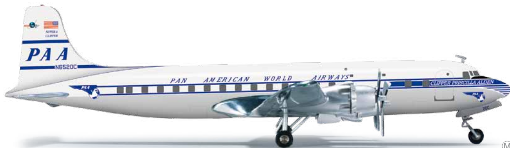
555210 Pan American World Airways McDonnell Douglas DC-6B 1/200 55,00 €

Neue Registration / New registration: VH-OQF „Charles Kingsford Smith“