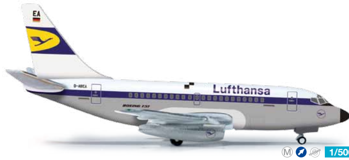
523332 1/500 19,50 € Lufthansa (Experimental colors) Boeing 737-100 Auf Betreiben der Lufthansa startete Boeing nur widerwillig das Projekt 737. 1967 erhielt die erste 737-100 der Lufthansa für die Flugerprobung diese Mischbemalung aus Alt und Neu. Only under pressure from Lufthansa, Boeing reluctantly started the 737 project. The first Lufthansa 737-100 received this livery mix of old and new for flight testing in 1967.