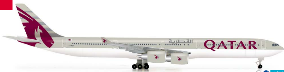
519083 Qatar Airways Airbus A340-600 M 1/500 24,00 €

Die „Airline des Jahres 2011“ bleibt ungebrochen auf Wachstumskurs. Derzeitige Flaggsschiffe sind, zumindest bis zur Indienstellung der ersten A380, vier Airbus A340-600. / The “Airline of the Year 2011” continues its course for success. Current flagships are – at least until the commissioning of the first A380 – four Airbus A340-600s.