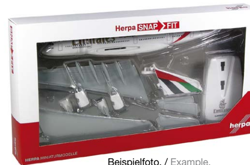
Beispielfoto. / Example.

Die ursprünglich für den Bordverkauf konzipierten Kunststoff-Steckmodelle mit überzeugendem Preis-/Leistungsverhältnis finden immer mehr Zuspruch bei Flugzeugfans und Sammlern. Zukünftig erhalten die Flugzeuge eine attraktivere Verpackung im HERPA SNAP-FIT Design. Der gewohnt schnelle und einfache Zusammenbau ohne Kleber und die Montage auf dem beigefügten, attraktiven Stand bleiben unverändert. / These plastic push-fit models, originally designed for inflight sales and known for their great value for the money, are gaining a growing following among aviation fans and collectors. In the future, the packaging of the models will be changed to an attractive HERPA SNAP-FIT design. The popular features such as the attractive display stand and the quick and easy assembly without glue remain unchanged.