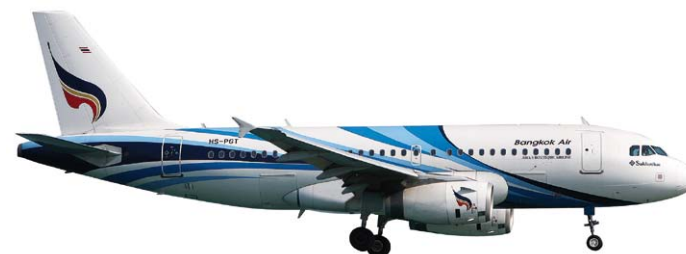
562300 Bangkok Airways Airbus A319 "Sukhothai" M 1/400 29,00 €

Die an Renommee und Flottengröße stark wachsende nationale Airline der Türkei hat vor kurzem ein leicht modernisiertes Erscheinungsbild eingeführt, das hier erstmals in Modellform nachgebildet wird. / Turkey’s national airline, which is strongly growing in terms of reputation and fleet size, has recently introduced a slightly modernized appearance as premiered on this model.