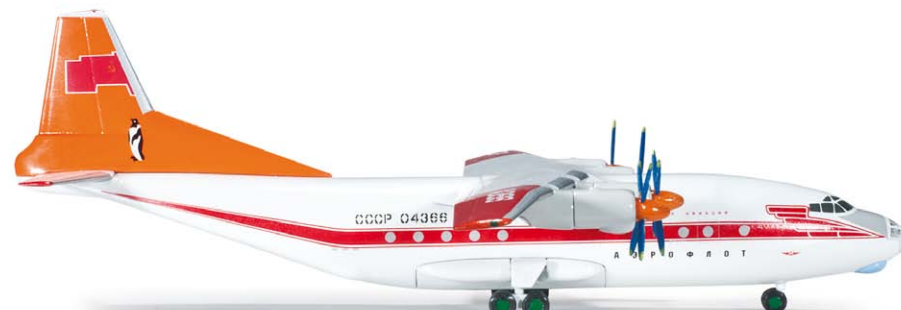
554855 Aeroflot Polar Aviation Antonov AN-12 K 1/200 46,00 €

Zur Ablösung der Boeing 717 beschaffte die „Boutique-Airline“ ab 2008 sechs A319. Erstes Exemplar war HS-PGT, getauft auf den Namen der alten Königsstadt Sukhothai. / To replace the Boeing 717, the self-named “Boutique-Airline” purchased six A319s from 2008. The first plane was HS-PGT, named after the old royal city of Sukhothai.