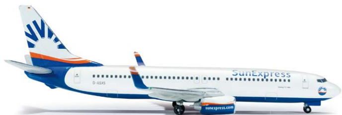
519090 Sun Express Deutschland Boeing 737-800 M 1/500 19,00 €

Die „Airline des Jahres 2011“ bleibt ungebrochen auf Wachstumskurs. Derzeitige Flaggsschiffe sind, zumindest bis zur Indienstellung der ersten A380, vier Airbus A340-600. / The “Airline of the Year 2011” continues its course for success. Current flagships are – at least until the commissioning of the first A380 – four Airbus A340-600s.