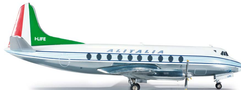
554732 Alitalia Vickers Viscount 700 M 1/200 46,00 €

1961 nahm diese speziell ausgerüstete AN-12 Teil an einer Forschungsexpedition in die Antarktis teil. Zur leichteren Erkennung der Maschine, erhielt sie eine außergewöhnliche Bemalung in Orange und Rot. / In 1961, this specially equipped AN-12 took part in a research expedition to Antarctica. To recognize the plane more easily, it received an extraordinary high-visibility livery in orange and red.