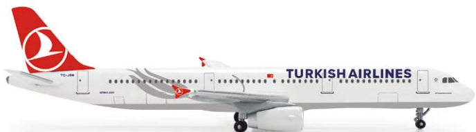
519106 Turkish Airlines Airbus A321 M 1/500 19,00 €

1989 von Lufthansa und Turkish Airlines gegründet, fliegen seit 2011 drei 737-800 für die neu gegründete deutsche Tochtergesellschaft. Neben Zielen in der Türkei bedienen sie nun auch Spanien und Nordafrika. Established in 1989 by Lufthansa and Turkish Airlines, three 737-800s have been flying for the newly created German subsidiary, which – next to destinations in Turkey – also services destinations in Spain and North Africa.