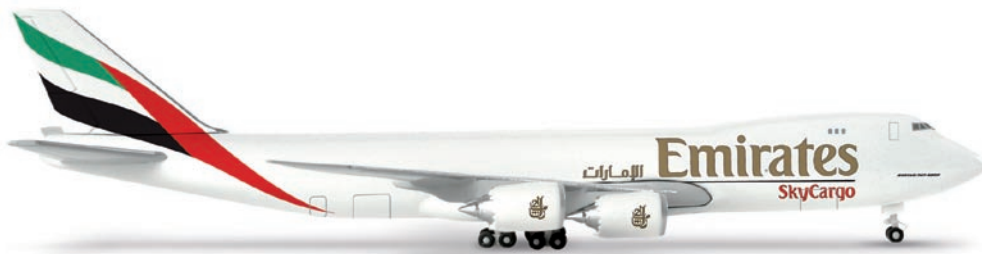
518093 | Emirates Sky Cargo Boeing 747-8F 27,00 € 1/500 Zur Expansion ihres Frachtgeschäfts erhält Emirates SkyCargo sukzessive vorerst 15 Exemplare des neuesten 747-Frachters. / Beginning in 2011, Emirates SkyCargo will gradually receive 15 aircraft of the latest 747 freighter for now to expand its cargo business. (M)