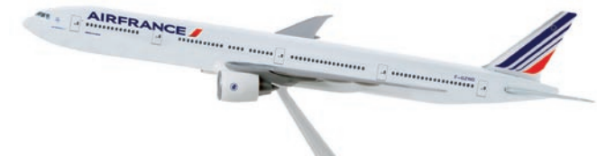
608909 | Air France Boeing 777-300ER

1/200 Modelllänge 36,9 cm / Model length 14.5 in