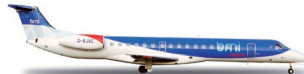
518079 | BMI Regional Embraer ERJ-145 16,00 €

1/500 Die Tochtergesellschaft der British Midland International (BMI) hat ihren Sitz im schottischen Aberdeen und betreibt eine reine Embraer-Flotte. / The subsidiary of British Midland International (BMI) has its headquarters in Aberdeen, Scotland and operates an all-Embraer fleet.