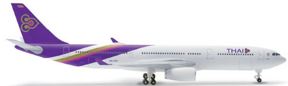
518147 | Thai Airways Airbus A330-300 23,00 € 1/500 1995 erhielt Thai ihre erste A330. Als einer der neuesten Maschinen kam 2009 das Original zur Flotte, getauft auf den Namen der thailändischen Prinzessin Sri Anocha. / In 1995, Thai received its first A330. The original, named after the Thai princess Sri Anocha, was one of the latest aircraft added to the fleet in 2009. (M)