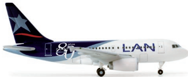
518109 | LAN Airbus A318 „80 years“ 18,00 € 1/500 1929 gegründet, zählt LAN heute zu einer der renommiertesten Airlines Südamerikas. Zur Feier des seltenen Jubiläums trägt diese A318 ein besonderes Logo auf dem Rumpf. / Founded in 1929, LAN has become one of the most renowned South American airlines. To celebrate this rare anniversary, this A318 features a special logo on the fuselage. (M) (P)