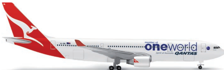
518116 | Qantas Airbus A330-200 „OneWorld“ 24,00 € 1/500 Wie die übrigen Mitglieder schmückt auch Qantas eine ihrer A330-200 mit der Sonderbemalung des One World-Bündnisses. / Like the other members, Qantas too, decorated one of its A330-200s with the special livery of the One World alliance. (M)