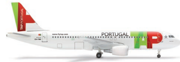
518130 | TAP Air Portugal Airbus A320 17,50 € 1/500 Diese jüngste von insgesamt 17 A320 der TAP-Flotte trägt den Namen des Grao Vascos Kunstmuseums der portugiesischen Stadt Viseu. / This youngest of 17 A320s in the TAP fleet carries the name of the Grao Vascos Art Museum in the Portuguese city of Viseu. (M) (P)