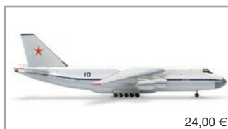
504942 | Soviet Air Force Antonov AN-124