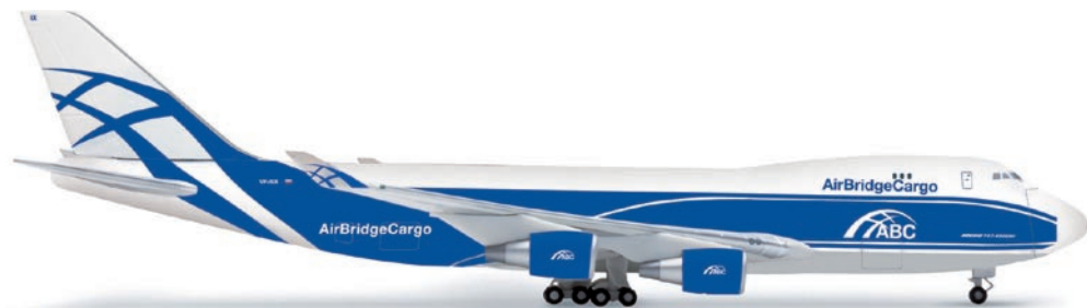
518192 | Air Bridge Cargo Boeing 747-400F 24,00 €

1/500 Nach dem Modell in 1:400 folgt nun auch das aktuelle Rückgrat der sehr erfolgreich agierenden Air Bridge Cargo Flotte im Maßstab 1:500. / After the 1/400 model, we now also release the current backbone of the very successfully operating Air Bridge Cargo fleet in the 1/500 scale.