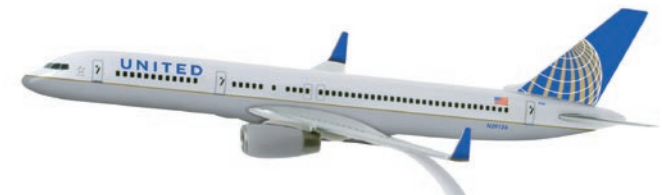
608930 | United Airlines Boeing 757-200

1/200 Modelllänge 23,7 cm / Model length 9.3 in