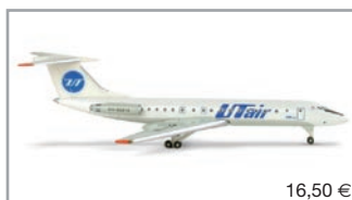
504973 | UT Air Tupolev TU-134