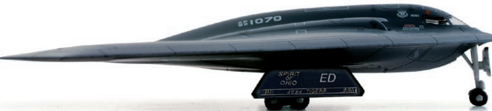
553919 | USAF Northrop Grumman B-2A Spirit, 412 th Test Wing "Spirit of Ohio" - "Fire & Ice" 48,00 €

1/200 Nach ihrem Erstflug im Jahr 1992 wurden mit der „Spirit of Ohio“ zahlreiche Testreihen unter schwierigen klimatischen Bedingungen durchgeführt. Daher gab die Crew der Maschine den Spitznamen „Fire & Ice“ und kreierte extra dafür das Logo am Fahrwerksschacht. / After the maiden flight in 1992, at first numerous test series under difficult climatic conditions were conducted with the „Spirit of Ohio“, which is why the crew gave it the name “Fire & Ice” and even created a special logo for it on the wheel well.