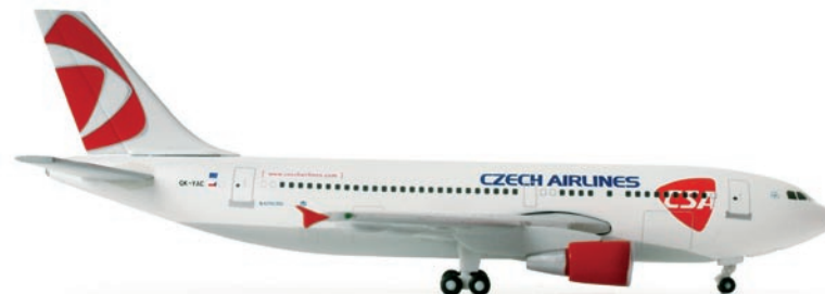
518086 | CSA Airbus A310-300 22,00 €

1/500 Mit dem Verkauf der letzten ihrer drei A310 endete die langjährige Tradition der nationalen tschechischen Fluggesellschaft als Langstrecken-Airline. / In 2010, the long standing tradition as long-haul airline of the Czech Republic's national airline came to an end when the last of its three A310s was sold.