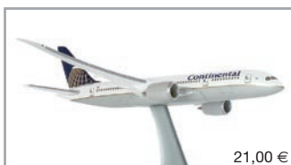
505345 | Continental Airlines Boeing 787-8