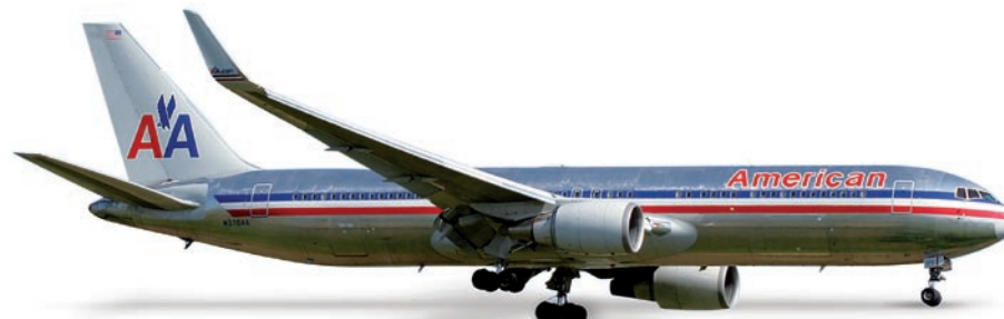
517980 | American Airlines Boeing 767-300ER 23,00 €

1/500 American war die erste Airline, die ab 2008 ihre betagten 767 mit den neuen Winglets ausrüstete. Das Modell erscheint wie alle American Modelle in einem polierten Metall-Finish. / Starting in 2008, American was the first airline to equip its aged 767s with the new winglets. Like all other American models, this model too, will be released in a polished metal finish.