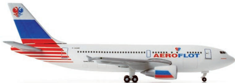
518185 | Aeroflot Airbus A310-300 „test livery“ 22,00 €

1/500 Nach der Auflösung der UdSSR suchte Aeroflot eine neue, russische Identität und präsentierte 1992 der Öffentlichkeit diese Bemalung mit Doppelkopfadler. / After the USSR's dissolution, Aeroflot was looking for a new, Russian identity and presented this livery with this double-headed eagle in 1992.