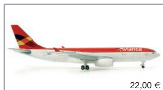
517607 | Avianca Airbus A330-200