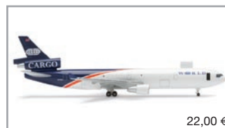
507660 | World Airways McDonnell Douglas MD-11F