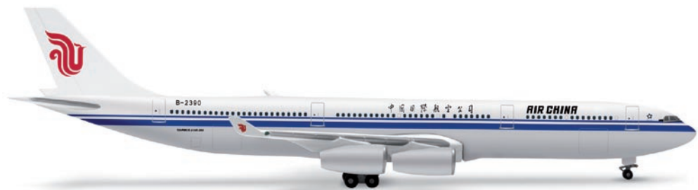
517973 | Air China Airbus A340-300 23,00 €

1/500 Sechs Exemplare des Langstreckenjets betreibt die nationale Airline der Volksrepublik China derzeit. Seit Ende 2007 ist sie Mitglied in dem Airline-Verbund Star Alliance. / The national airline of the People's Republic of China currently operates six of these long-haul jets. It has been a member of the Star Alliance since the end of 2007.