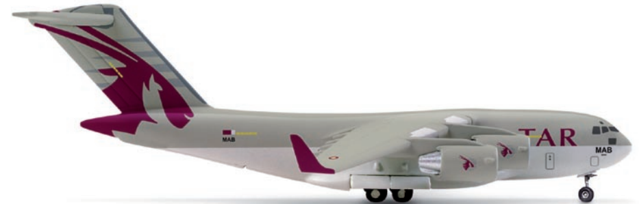
518123 | Qatar Air Force Boeing C-17A Globemaster III 23,00 € 1/500 Die derzeit farbenprächtigste C-17 betreibt das Emirat Qatar. Aktuell stehen zwei Flugzeuge im Dienst der Streitkräfte, eine davon im nahezu identischen Farbenkleid der Qatar Airways. / The emirate Qatar currently operates the most colorful C-17. Two airplanes are in service for the armed forces, one of them featuring almost the identical color scheme of Qatar Airways. (M)