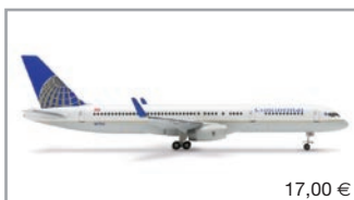
510271 | Continental Airlines Boeing 757-200ER