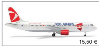
509565 | CSA Czech Airlines Airbus A320