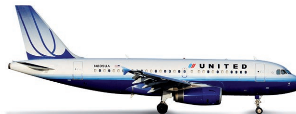
517911 | United Air Lines Airbus A319

Aus dem Zusammenbruch der alten nationalen Airline Griechenlands formierte sich Ende 2009 die Olympic. Mit neuer Flotte und neuer Bemalung wagt sie nun den Neuanfang. / From the collapse of Greece's old national airline emerged Olympic in the end of 2009. It starts afresh with new fleet and new livery.