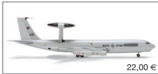
515139 | NATO Boeing E-3 "Sentry"