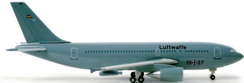
517782 | Luftwaffe (Flugbereitschaft) Airbus A310MRTT 22,00 € 1/500 Für die neue Aufgabe der Luftbetankung erhalten die MRTTs („Multi Role Transport and Tanker“) Schlauchbehälter unter jeder Tragfläche. / For in-air refueling tasks, the MRTTs (Multi Role Transport and Tanker) received hose containers underneath each wing.