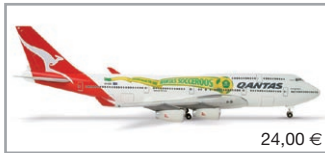
515597 | Qantas Boeing 747-400 "Socceroo"