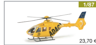
742450 | ADAC Eurocopter EC 135 (Fertigmodell / fully assembled model)