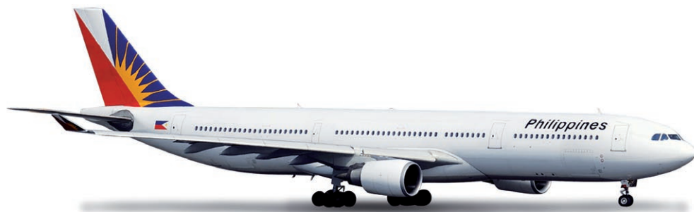
517867 | Philippine Airlines Airbus A330-300

Die A319 bildet das kleinste Flugzeugmuster in der Flotte der United. Zu den bereits betriebenen 55 Exemplaren werden weitere 23 ab 2013 die Flotte erweitern. / The A319 is the smallest airplane type in the United fleet. Currently, 55 airplanes are in operation, another 23 will be added from 2013.