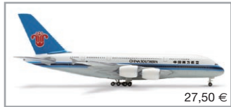
513401 | China Southern Airlines Airbus A380-800