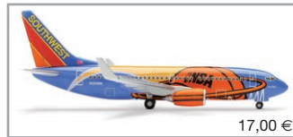
503211 | Southwest Boeing 737-700 "Slam Dunk One"