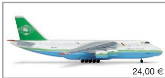
507752 | Libyan Air Cargo Antonov AN-124