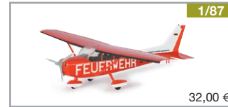
019224 | Feuerwehr Flugdienst Lüneburg Cessna 182 Skyhawk