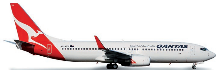
517850 | Qantas Boeing 737-800

Mit der neuer Kennung D-AILW und dem Taufnamen „Donaueschingen“ zählt jetzt wieder eine Lufthansa A319 zur Herpa-Collection. / With the new registration D-AILW and the name "Donaueschingen", the Lufthansa A319 is once again part of the Herpa-Collection.