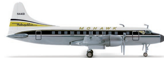
517829 | Mohawk Airlines Convair CV-440 17,50 € 1/500 Mohawk war eine sehr innovative und in den 1950er und 1960er Jahren äußerst erfolgreiche Regional-Airline im Nordosten der USA. Bekannt wurde sie auch durch die Benennung nach dem Indianer-Volk der Mohawk. Der Name war das Resultat eines Wettbewerbes durch Passagiere im Jahre 1952. / Mohawk was a very innovative and in the 1950s and 60s very successful airline in the north-east of the USA. It became known inter alia by its naming after the Native American Mohawk tribe. The name was the result of a passenger competition in 1952.