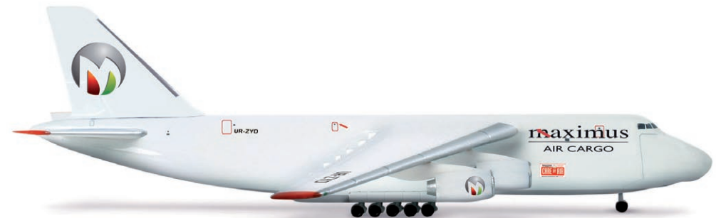
517577 | Maximus Air Cargo Antonov AN-124 27,50 € 1/500 Die noch sehr junge, aber bereits größte Fracht-Airline der Vereinigten Arabischen Emirate betreibt diese AN-124 als größtes Flugzeug der Flotte. / The biggest airplane by the rather young but already biggest cargo airline of the United Arabian Emirates is this AN-124.