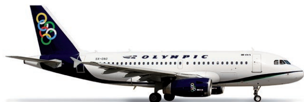
517836 | Olympic Airlines Airbus A319