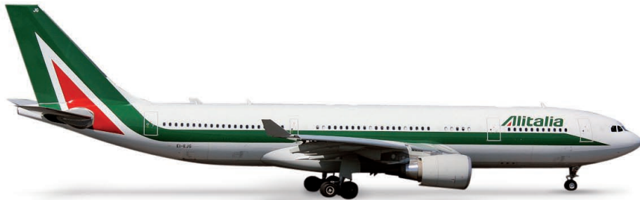
517713 | Alitalia Airbus A330-200 22,00 € 1/500 Zur Modernisierung der Langstreckenflotte sollen nun Zug um Zug die altgedienten Boeing 767 durch fabrikneue Airbus A330 ersetzt werden. / To modernize the long-haul fleet, the veteran Boeing 767s will be replaced step by step by brand-new Airbus A330s.