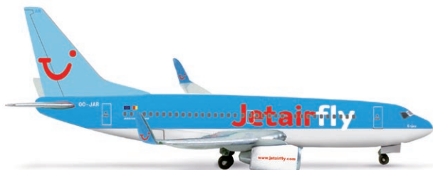
517775 | JetairFly Boeing 737-700 17,50 € 1/500 Drei 737 der 700er Serie verstärken seit 2009 die Flotte des belgischen Ablegers des Reisekonzerns TUI. / Since 2009, three 737s of the 700 series have been supporting the fleet of the Belgian branch of the travel company TUI.