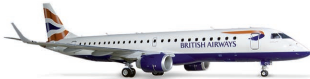
517737 | British Airways / BA Cityflyer Embraer 190 18,00 € 1/500 Die BA-Tochter betreibt derzeit fünf Embraer 190, die hauptsächlich ab dem Londoner Stadtflughafen zum Einsatz kommen. / The BA subsidiary currently operates five Embraer 190s, which are mainly flying from the London city airport.