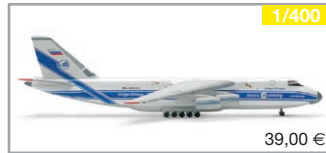
561419 | Volga Dnepr Antonov AN-124