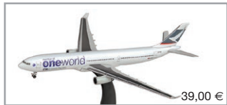
515573 | Cathay Pacific Airbus A330-300 "One World"