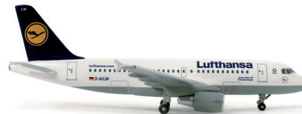
518031 | Lufthansa Airbus A319

Mit insgesamt acht Flugzeugen vom Typ A330 bedient Philippine Airlines seit 1997 ihre Kurz- und Mittelstrecken. / Since 1997, Philippine Airlines has been operating its short and medium haul routes with eight airplanes of the type A330.