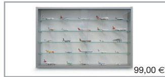
029377 | Glas-Vitrine / Glass cabinet