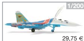
551816 | Russian Knights Aerobatic Team – open cockpit Sukhoi SU-27UB