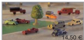
520300 | Zubehör / Accessories „Classic Cars“