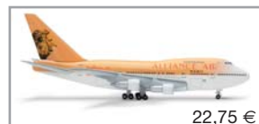
515207 | Alliance Air Boeing 747SP