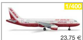
561471 | Air Berlin Airbus A320