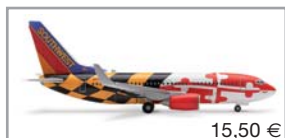
505666 | Southwest Airlines Boeing 737-700 „Maryland One“