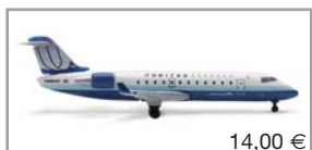
514439 | United Express Bombardier CRJ200