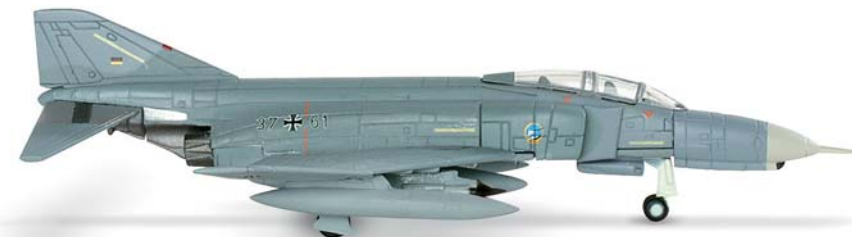
552271 | Luftwaffe McDonnell Douglas F-4F Phantom II ICE

„Showtime 100“ – VF-96 „Fighting Falcons“, CVW-9, USS Constellation, 1972 | Serienmodell wird exakte Waffenladung der „Showtime 100“ vom 10. Mai 1972 aufweisen / Production version will have the exact external armament of „Showtime 100“ as flown on May 10, 1972