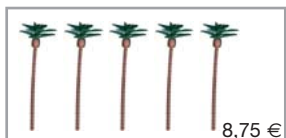
520546 | Zubehör / Accessories Palmen / Palm Trees