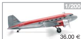
551250 | Herpa Douglas DC-3