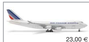
503181 | Air France Cargo Boeing 747-400F