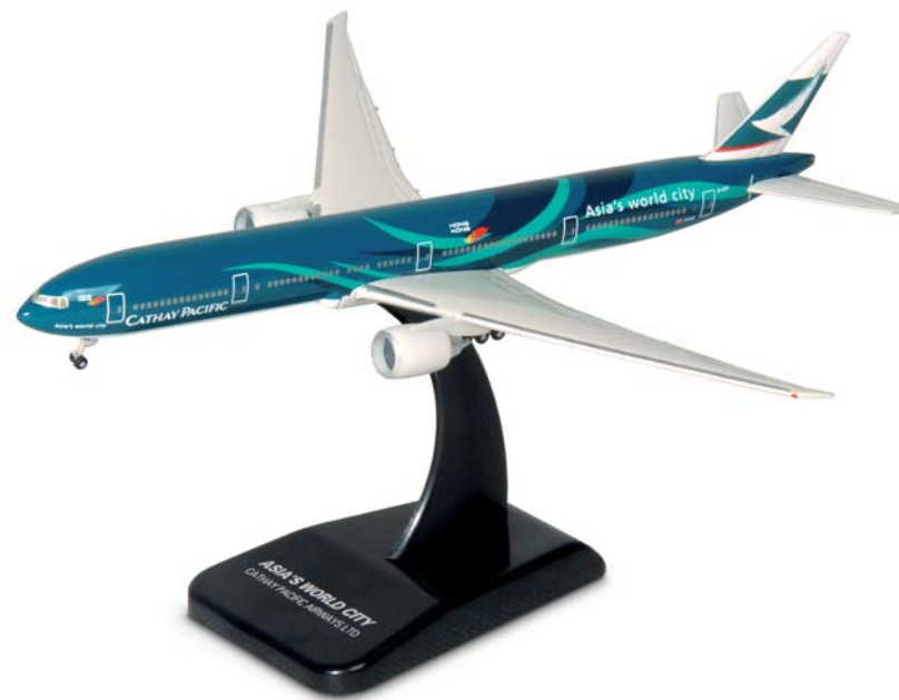
503280 | Cathay Pacific Airways Boeing 777-300ER „Asia's World City“