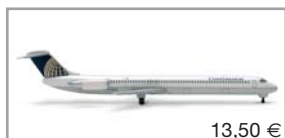
506021 | Continental Airlines McDonnell Douglas MD-81