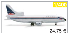
560658 | Delta Air Lines Lockheed 1011-500