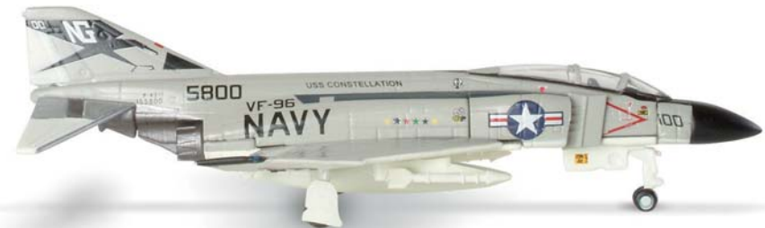
552257 | US Navy McDonnell Douglas F-4J Phantom II