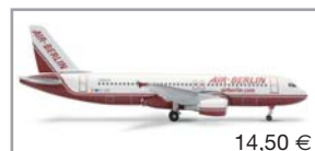
509114 | Air Berlin Airbus A320