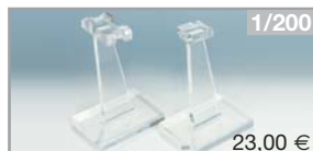
016254 | Standvorrichtung für A300-600