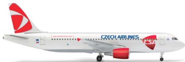
509565 | CSA Czech Airlines Airbus A320