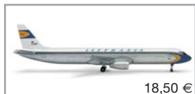
514637 | Lufthansa „Retro“ Airbus A321