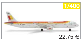
561181 | Iberia Airbus A321