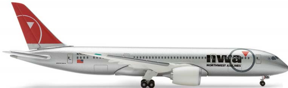
507929 | Northwest Airlines Boeing 787-8 „Dreamliner“ (on ground version)