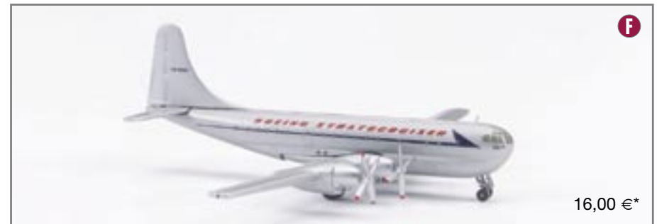
513869 Boeing Milestone Series Boeing 377 Stratocruiser