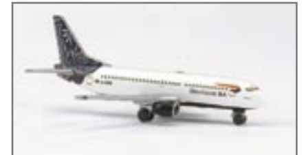
Deutsche BA Boeing 737-300 „Edelweiss“