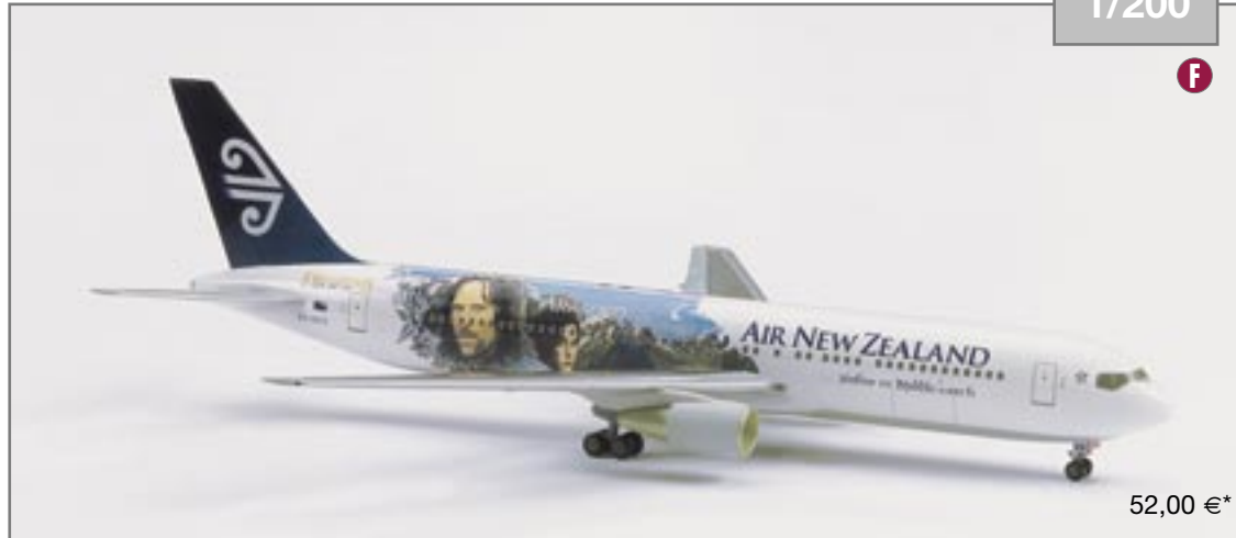
550772 Air New Zealand Boeing 767-300 „Lord of the Rings - Aragorn“