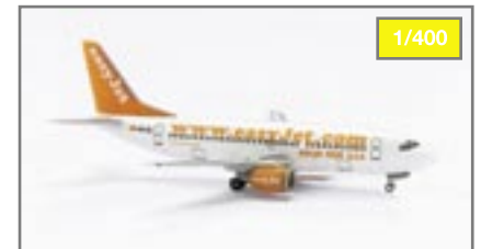
Easyjet Boeing 737-300