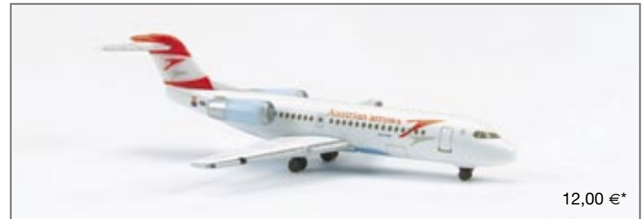
509336 Austrian Arrows Fokker 70