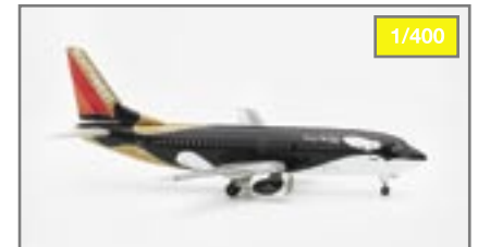
Southwest Boeing 737-300 „Shamu“