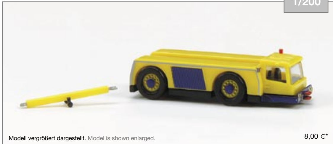
550796 Kögel KAMAG TowBear