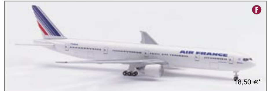
506656 Air France Boeing 777-300ER

For some, the Boeing 377 Stratocruiser is the world's most luxurious piston-engine plane of all time, setting the benchmark for First Class. For others, the Stratocruiser is simply a huge and shapeless monster that too readily dropped out of the sky. No matter what your opinion of this revolutionary aircraft type, the Stratocruiser introduced an incredibly comfortable way of flying, but due to its high operational and maintenance costs, it did not become a sales hit. The first Stratocruiser is released with the original manufacturer's livery, and looks the way it was painted when it took off for the very first time.